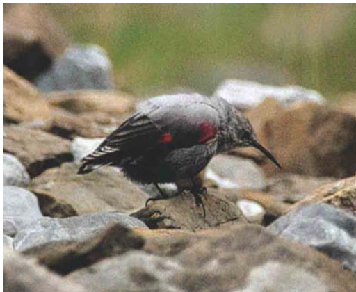
344-345 Wallcreeper / Rotskruiper Tichodroma muraria , first-winter, Cirque de Gavarnie, Gavarnie, Hautes-Pyrénées, France, 7 September 1995

Wallcreeper's conspicuously crimson-coloured wings makes one wondering why the colour needs to be so radiant in such a poor environment as limestone-dolomite rock faces, where a dull or cryptically coloured bird might be expected. Another mystery is why a bird on a bare and steep rock face should draw attention to itself by its shimmering, continuously flicking wings; prominent restlessness is an unusual survival tactic,