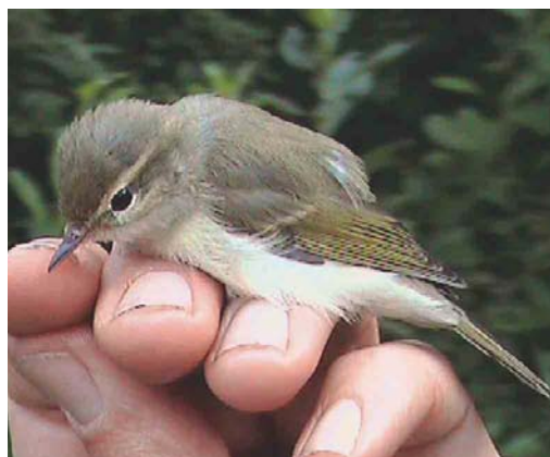
336 Grauwe Fitis / Greenish Warbler Phylloscopus trochiloides , juveniel, Groene Glop, Schiermonnikoog, Friesland, 29 juli 2003

vogels meer gezien of gehoord, ondanks dagelijkse wandelingen tot en met 2 augustus.