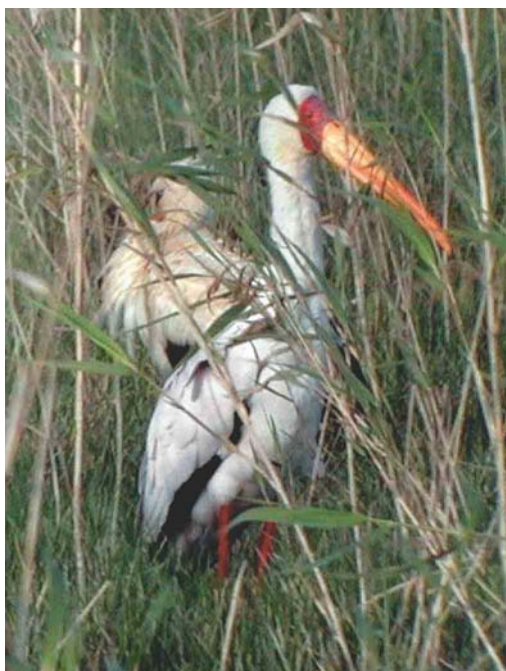
185 Montagu's Harrier / Grauwe Kiekendief Circus pygargus , dark-morph male, Belen, Spain, 13 April 2003 186 Yellow-billed Stork / Afrikaanse Nimmerzat Mycteria ibis , with White Stork / Ooievaar Ciconia ciconia , Casa de Bombas, Brazo de la Torre, Isla Mayor, Sevilla, Spain, 14 April 2003 187 Swinhoe's Storm-petrel / Chinees Stormvogeltje Oceanodroma monorhis , Eilat, 19 April 2003