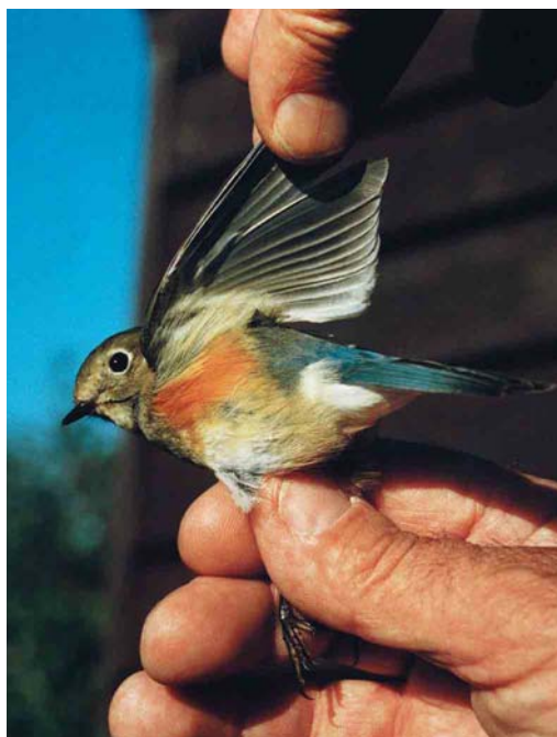
164-165 Blauwstaart / Red-flanked Bluetail Tarsiger cyanurus , eerstejaars mannetje, Kroonspolders, Vlieland, Friesland, 11 oktober 1999

KOP Grotendeels olijfbroin; voorhoofd, teugel en gebied onder oog iets lichter bruin. Oogring witachtig. BOVENDELEN Rug en mantel egaal olijfbroin, op stuit overgaand in blauwachtige bovenstaartdekveren. ONDERDELEN Borst donker olijfbroin. Flank oranje. Rest van onderdelen grotendeels crèmekleurig wit. Onderstaartdekveren witachtig. VLEUGEL Hand- en armpennen bruin met lichtere olijf-