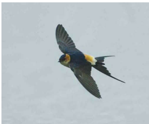
227-228 Roodstuitzwaluw / Red-rumped Swallow Hirundo daurica , Eijsder Beemden, Limburg, 19 april 2003 (Karel Lemmens)

mei druppelden er opnieuw waarnemingen binnen. Pieter Duin en Eric Menkveld ontdekten op 2 mei een Roodstuitzwaluw boven de Geul op Texel, Noord-Holland, die tot 5 mei aanwezig bleef en vanaf 4 mei werd vergezeld door een tweede. Op 3 mei trokken er exemplaren over Middelburg, Zeeland, en langs de Vlinderbalg aan de oostkant van het Lauwersmeergebied, Groningen. Op 4 mei vlogen er nog exemplaren langs Breskens en langs Bakkeveen, Friesland, en op 12 mei was een exemplaar ter plaatse bij het Jaap Deensgat in de Lauwersmeer, zodat de teller half mei al op 14 stond.