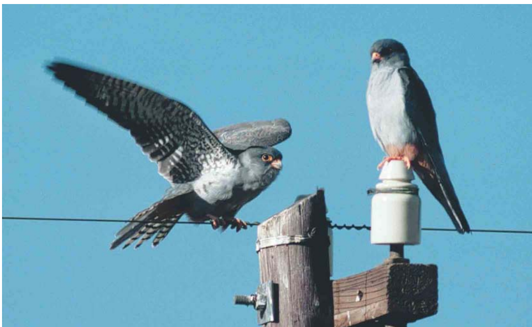
162 Amur Falcons / Amoeroodpootvalken Falco amurensis , second calendar-year male (left) and adult male, Boshof, Orange Free State, South Africa, 17 March 1996 ( Arnoud B van den Berg )