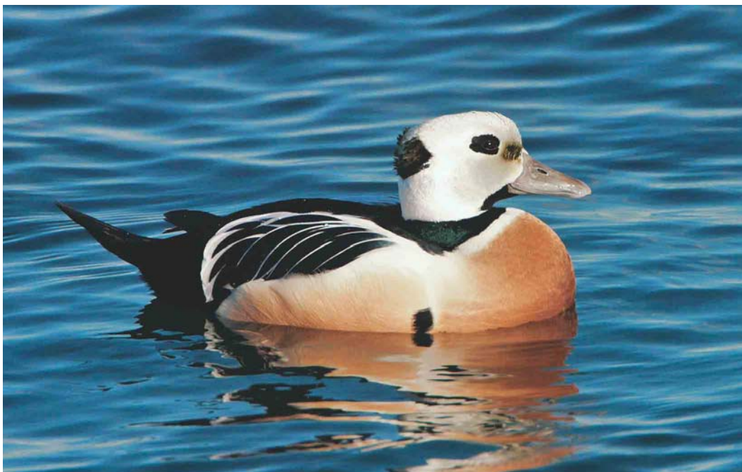
182 Steller's Eider / Stellers Eider Polysticta stelleri , adult male, Borgarfjörður Eystri, Iceland, 23 March 2003 (Daníel Bergmann)