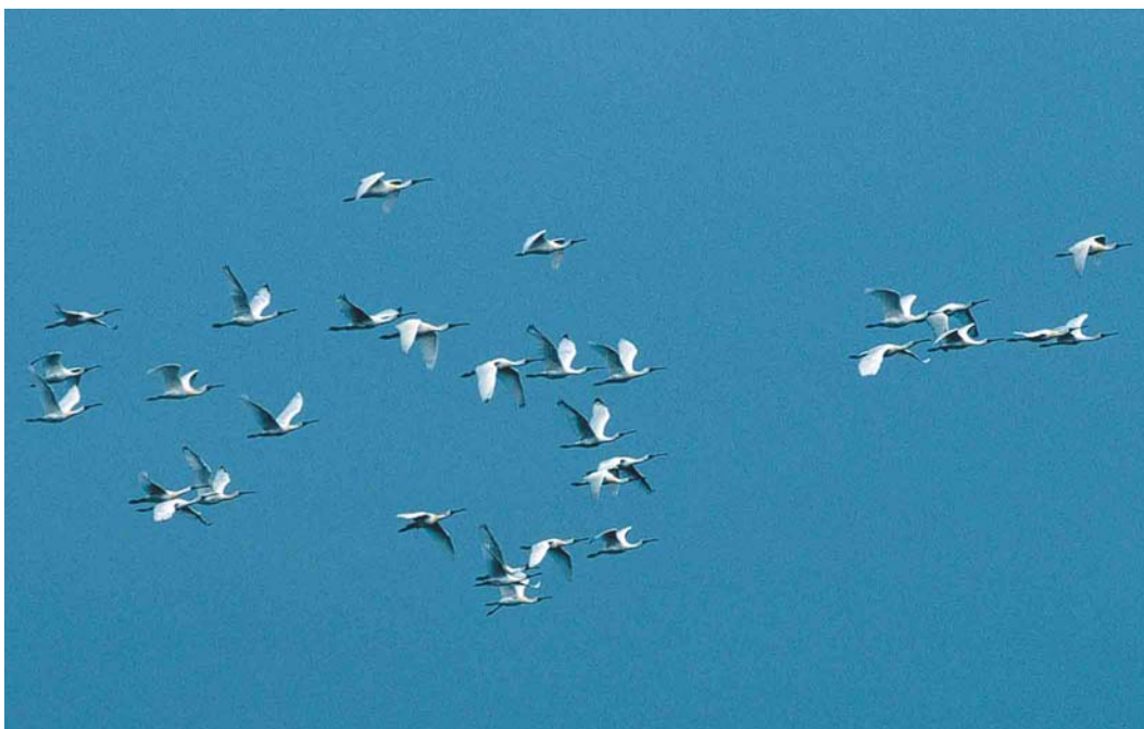
181 Black-faced Spoonbills / Kleine Lepelaars Platalea minor , Mai Po, Hong Kong, China, 3 March 2003 (Roef Mulder)