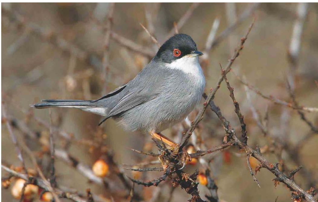
201 Sardinian Warbler / Kleine Zwartkop Sylvia melanocephala , male, Holme, Norfolk, England, 22 March 2003 (Bill Baston)