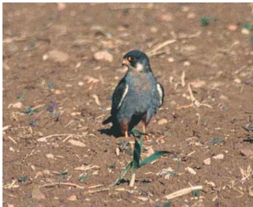
156-157 Red-footed Falcon / Roodpootvalk Falco vespertinus , first-summer male, Madria, Cyprus, 5 May 1997 (Graham P Catley)

Our notes are based on field experience in South Africa, on studies of skins of amurensis , and on field observations of several 1000s vespertinus in Italy, elsewhere in Europe and in the