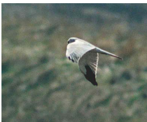
209 Dwergaalscholver / Pygmy Cormorant Microcarbo pygmeus , Eijsder Beemden, Limburg, 23 maart 2003 ( Karel Lemmens ) 210 Amerikaanse Smient / American Wigeon Mareca americana , mannetje, Ouderkerkerplas, Ouderkerk aan de Amstel, Noord-Holland, 6 april 2003 ( Jan den Hertog ) 211-212 Steppekiekendief / Pallid Harrier Circus macrourus , mannetje, Breskens, Zeeland, 21 april 2003 ( Garry Bakker ) 213-214 Steppekiekendief / Pallid Harrier Circus macrourus , mannetje, Eemshaven-Oost, Groningen, 16 april 2003 ( Eric Koops )