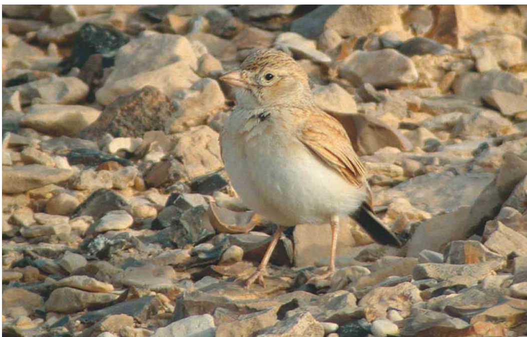
202 Dunn's Lark / Dunns Leeuwerik Eremalauda dunnii , Sede Boker, Israel, 6 April 2003 (James P Smith)