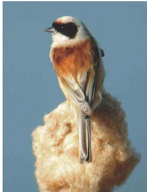
225 Buidelmees / Eurasian Penduline Tit Remiz pendulinus , Lier-Anderstad, Antwerpen, 23 maart 2003 (Kris de Rouck)

bedroeg 136 bij Rijkevorsel, Antwerpen, op 5 april. Op 9 maart pleisterde een adulte Ringsnavelmeeuw L. delawarensis te Roksem, West-Vlaanderen, en op 24 maart was er kortstondig een adulte aanwezig te Bredene. De adulte Grote Burgemeester L. hyperboreus van Oostende werd op 1 maart voor het laatst opgemerkt. Op 15 maart werd een eerste-winter gezien bij Diepenbeek. Langs Knokke trokken op 13 april twee Reuzensterms Sterna caspia en op 20 april vloog een Lachstern Gelochelidon nilotica langs Koksijde, West-Vlaanderen.