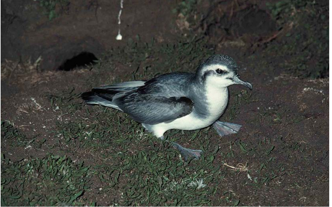
19 Slender-billed Prion / Dunbekprion Pachyptila belcheri , New Island, Falkland Islands, December 1990 (René Pop)