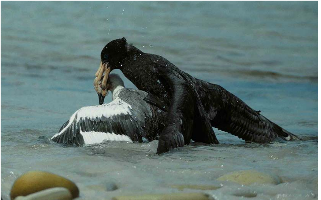
20 Southern Giant Petrel / Zuidelijke Reuzenstormvogel Macronectes giganteus , immature killing Upland Goose / Magelhaengans Chloephaga picta , New Island, Falkland Islands, January 1991 (René Pop)