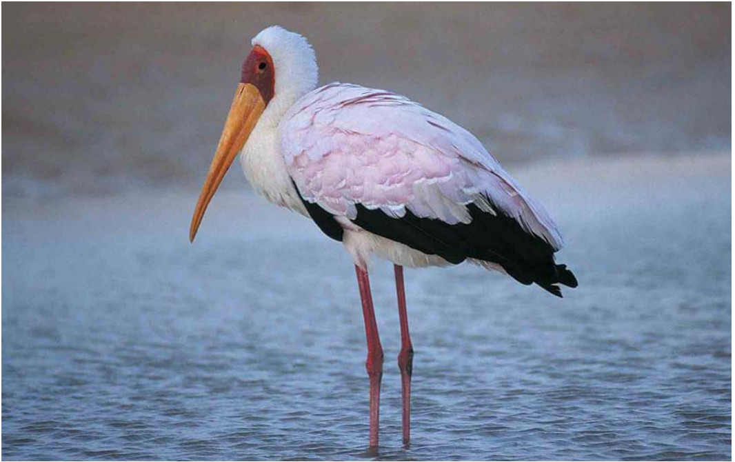
55 Yellow-billed Stork / Afrikaanse Nimmerzat Myxerpes ibis , Fuerteventura, Canary Islands, 7 November 2000