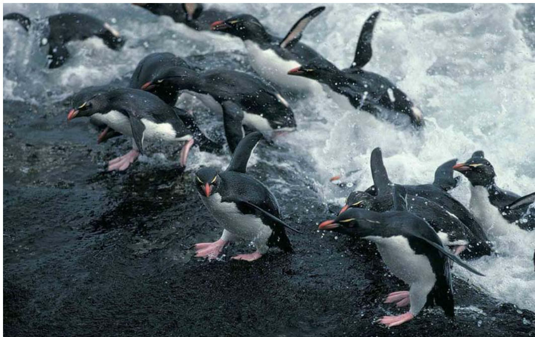
14 Rockhopper Penguins / Rotspinguïns Eudyptes chrysocome chrysocome , Saunders Island, Falkland Islands, December 1990