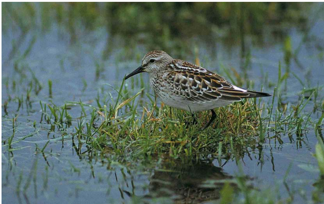
61 White-rumped Sandpiper / Bonapartes Strandloper Calidris fuscicollis , juvenile, Lough Beg, Londonderry, Northern Ireland, 30 October 2000