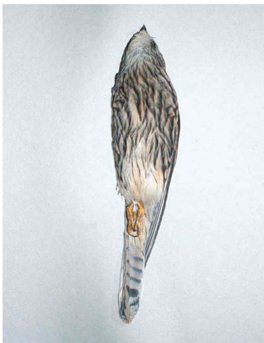
79-82 Kleine Torenvalk / Lesser Kestrel Falco naumanni , eerstejaars vrouwtje (gevonden bij Bergen, Noord-Holland, op 5 november 2000), Zoölogisch Museum Amsterdam, Noord-Holland, 18 december 2000