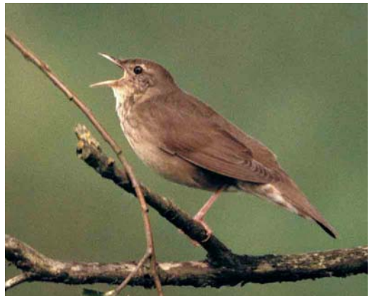
149 Dwergarend / Booted Eagle Hieraaetus pennatus , adult, donkere vorm, Rhenen, Gelderland, 24 juni 2000 150 Grijszwart / Black-winged Kite Elanus caeruleus , Meerstalblok, Drenthe, 12 juni 2000 151 Amerikaanse Wintertaling / Green-winged Teal Anas carolinensis , mannetje, Spaarndam, Noord-Holland, 5 mei 2000 152 Griel / Stone-curlew Burhinus oedicnemus , Maasvlakte, Zuid-Holland, 13 mei 2000 153 Baltische Mantelmeeuw / Baltic Gull Larus fuscus , subadult, Steenwaard, Houten, Utrecht, 30 april 2000 154 Krekeltzanger / River Warbler Locustella fluviatilis , Australiëhaven, Amsterdam, Noord-Holland, juni 2000