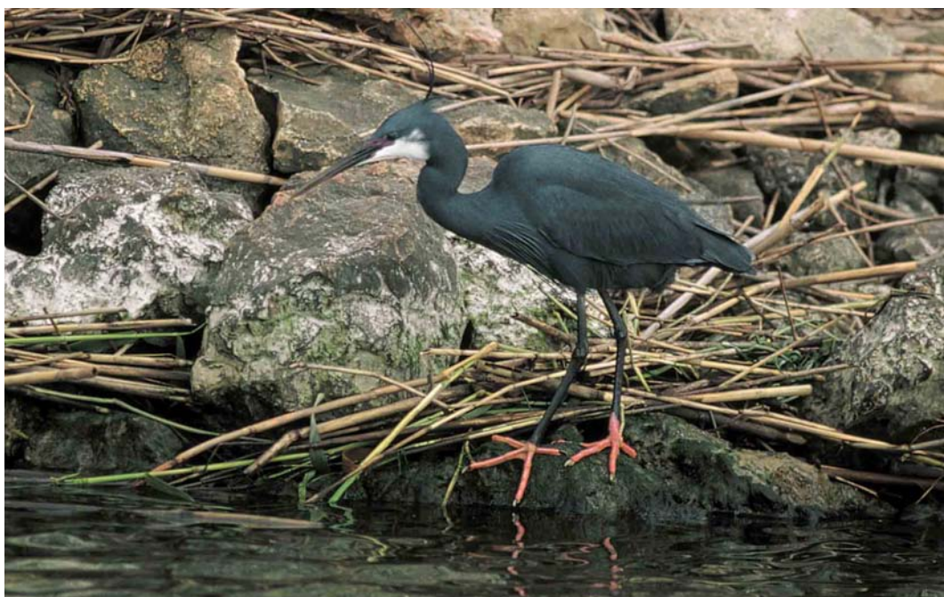
128 Western Reef Egret / Westelijke Rifeiger Egretta gularis , Ebro delta, Spain, 19 May 2000