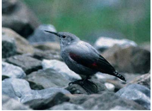
169 Wallcreeper / Rotskruiper Tichodroma muraria , Cirque de Gavarnie, Hautes-Pyrénées, France, 7 September 1995

inconspicuous bird, merging perfectly with the blue-grey background, into a very conspicuous bird. Wing-flicking is a slow movement performed constantly, not only when climbing but also when feeding or resting briefly. Juveniles do this as soon as they have fledged.