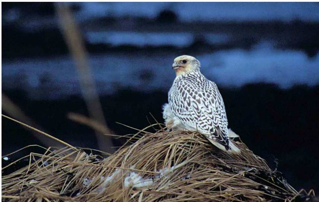
41 Gyr Falcon / Giervalk Falco rusticolus , Njarðvíkurfitjar, Iceland, 15 December 1998

Halland, Sweden. In Bulgaria, 230 Dalmatian Pelicans Pelecanus crispus and more than 1300 Pygmy Cormorants Microcarbo pygmeus were counted on 5 January. On 23-24 January, the first Pygmy Cormorant for the Netherlands stayed along Hollandse IJssel at Mastwijk, Montfoort, Utrecht. In Britain, a female Magnificent Frigatebird Fregata magnificens was found exhausted on 22 December 1998 in a field at Scarletts Point, Isle of Man, and was taken into care (where it was still alive in February).