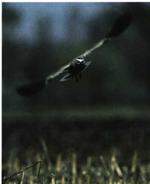
49 Sociable Lapwing / Steppekievit Vanellus gregarius , Eindhoven, Noord-Brabant, Netherlands, 5 April 1998

Netherlands. A female was present at Snettisham, Norfolk, on 25-28 April. In Norway, a Naumann's Thrush T naumanni naumanni was seen on 5-10 April at Finnanger, Namsos, Nord-Trøndelag. The first Dusky Thrush T n eunomus for the UAE stayed at Safa Park from 12 March onwards. The second Cetti's Warbler Cettia cetti for Sweden was a second-year trapped twice at Ottenby, Öland, during 24-27 April. At Eilat, two single Basra Reed Warblers Acrocephalus griseldis were seen on 24 March and from 26 March. Two single Hume's Warblers Phylloscopus humei were also present at Eilat from 24 March. In Dorset, England, a Dusky Warbler P fuscatus stayed from 23 January into March at Lodmoor, Weymouth. Photographs of an alleged hitherto unknown species, 'Bradshaw's Warbler' Hippolais magniocularis , trapped on 3 May 1989 at Maasvlakte, Zuid-Holland, show a Willow Warbler P trochilus (contra Br Birds 91: 190-191, 1998).