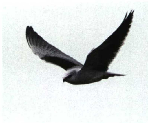
59 Grijs Wouw / Black-shouldered Kite Elanus caeruleus , adult, De Cocksdorp, Texel, Noord-Holland 30 maart 1998 (René van Rossum)

de bootjes van Schiermonnikoog, Friesland, waar ze eerder op de dag de witte Giervalk Falco rusticolus hadden gezien, naar de vastwal overgestoken en vandaar doorgereisd naar Texel. De Grijs Wouw bleef tot 31 maart op de noordpunt van het eiland en werd door zeker 300 belangstellenden bewonderd. De eerste Grijs Wouw voor Nederland betrof een exemplaar dat op 31 mei 1971 werd gefotografeerd langs de Knardijk bij Zeewolde, Flevoland (Limosa 46: 93-94, 1973).