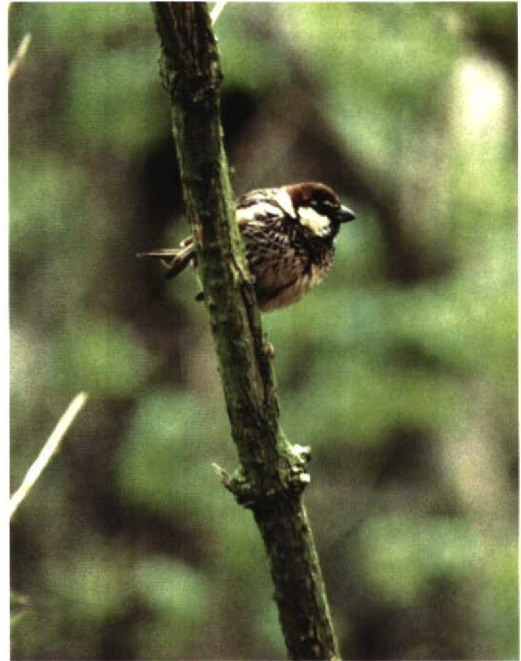
33 Spaanse Mus / Spanish Sparrow Passer hispaniolensis , De Cocksdoorp, Texel, Noord-Holland, mei 1997

De vogel van Texel was het eerste geval van Spaanse Mus voor Nederland. De soort werd in Noordwest-Europa ook vastgesteld in Finland (Hanko, 1 juni 1996; cf Dutch Birding 18: 143, 1996), Groot-Brittannië (Lundy, Devon, 9 juni 1966; St Mary's, Scilly, 21 oktober 1972; Bryher, Scilly, 22-24 oktober 1977; Martin's Haven, Pembrokeshire, 18 mei 1993; North Ronaldsay, Orkney, 11-19 augustus 1993; en Waterside, Cumbria, 13 juli 1996 tot ten minste november 1997; Dymond et al 1989, Duncan et al 1993, Rogers et al 1994, 1997, Bottomley 1996, Birding World 10: 481, 1997) en Noorwegen (Mølen, Larvik, Vestfold, 13 mei 1988; Lista, Farsund, Vest-Agder, 21 juli 1990; Bentz & Clarke 1990, Bosa & Clarke 1993). Al deze gevallen hadden betrekking op mannetjes. In Frankrijk (buiten Corsica) zijn er vier gevallen in het zuiden (Camargue, Bouches-du-Rhône, 6 juni 1961, 15 juni 1990 en 3 augustus 1991; Leucate, Aude, 15 juli 1990; Dubois & Yésou 1992; Dubois et al 1992). Bovendien werden op het terrein van de olieterminal van Le Havre-Antifer, Seine-Maritime, Frankrijk, op 1 mei 1995