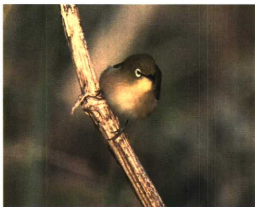
29 Japanese White-eye / Japanese Brilvogel Zosterops japonicus , Hegura-jima, Japan, October 1996. Note brown side of breast and ill-defined demarcation between yellow throat and green on side of neck and brown of breast