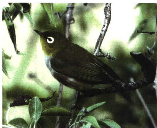
30 Chestnut-flanked White-eye / Roodflankbrilvogel Zosterops erythropleurus , Beidaihe, China, May 1996. Note grey side of breast and clear demarcation between yellow throat and grey breast

14 April 1990 at Den Haan aan Zee, West-Vlaanderen (ring number JD4269, left, additional red ring on right leg). Both records were rejected by the Flemish rarities committee (BAHC) because of the large escape risk and the unlikelihood of genuine vagrancy (Philippe Schepens in litt).