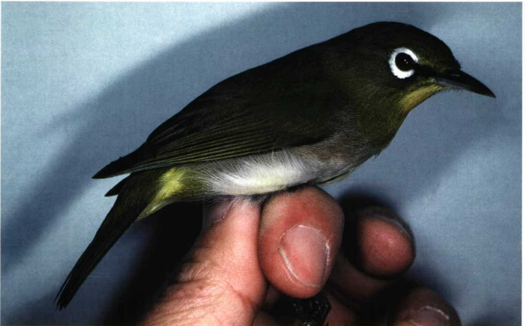
28 Japanese White-eye / Japanese Brillvogel Zosterops japonicus japonicus , first-winter male, Sekiya, Niigata City, Niigata, Japan, 28 October 1992 (Yoshimitsu Shigeta)