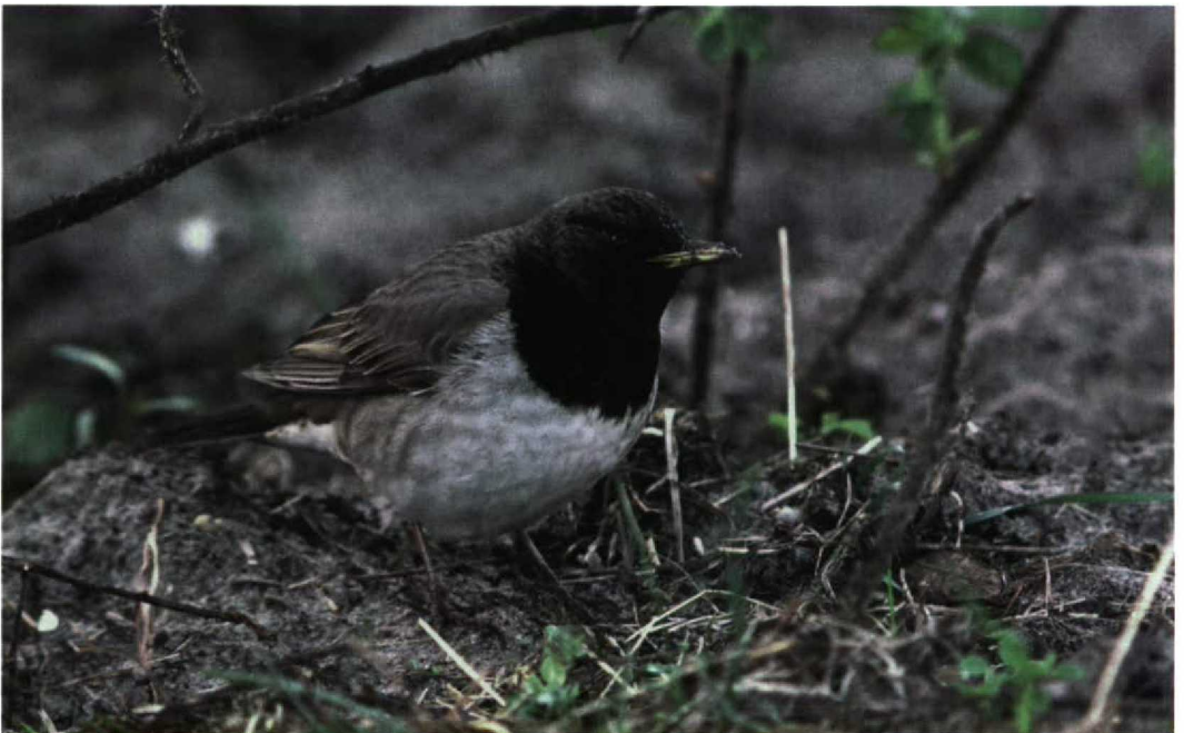
46 Black-throated Thrush / Zwartkeellijster Turdus ruficollis atrogularis , adult male, West-Terschelling, Terschelling, Friesland, Netherlands, 12 April 1998 (Ruud E Brouwer)