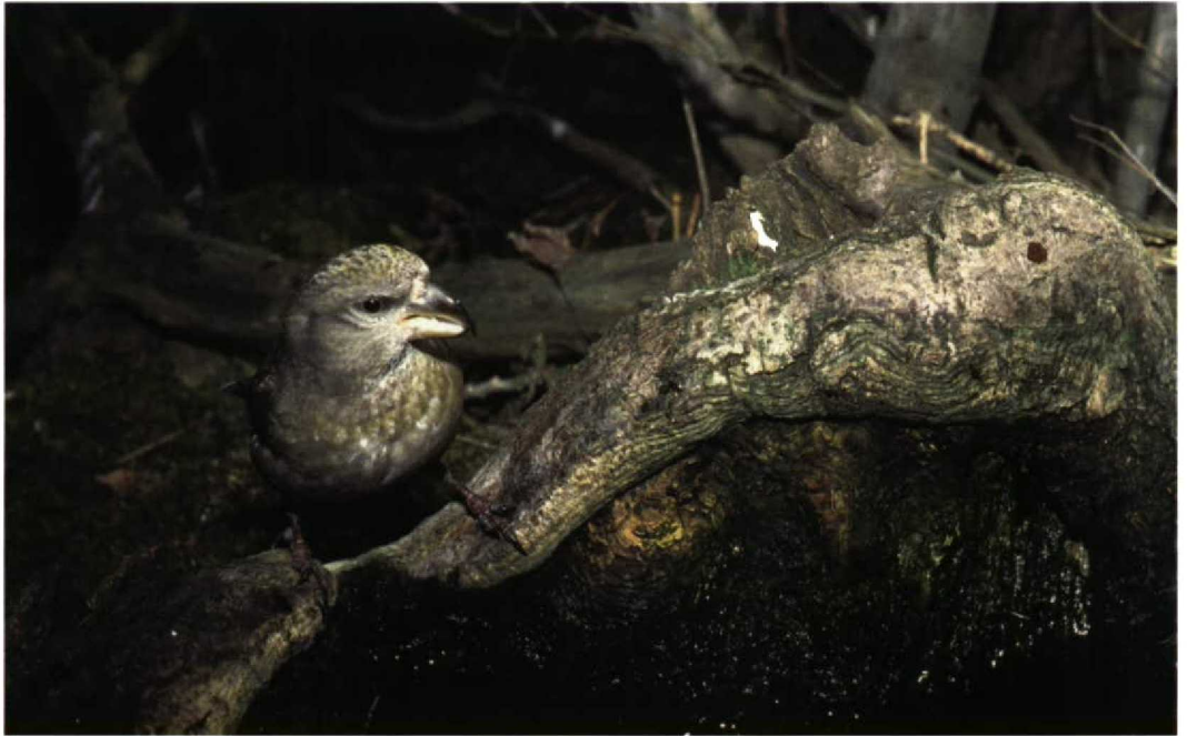
54 Grote Kruisbek / Parrot Crossbill Loxia pytyopsittacus , vrouwtje, Kennemerduinen, Noord-Holland, 13 februari 1998 (Arnoud B van den Berg)