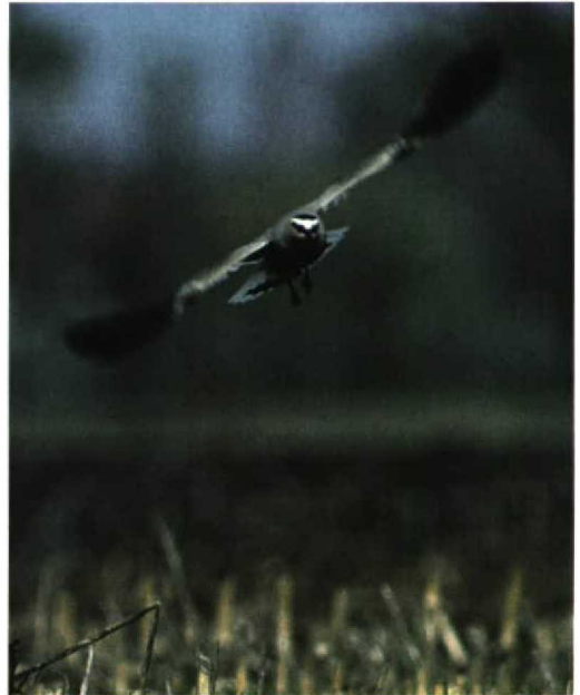
49 Sociable Lapwing / Steppiekievit Vanellus gregarius , Eindhoven, Noord-Brabant, Netherlands, 5 April 1998 (Patrick Palmen)

Netherlands. A female was present at Snettisham, Norfolk, on 25-28 April. In Norway, a Naumann's Thrush T naumanni naumanni was seen on 5-10 April at Finnanger, Namsos, Nord-Trøndelag. The first Dusky Thrush T n eunomus for the UAE stayed at Safa Park from 12 March onwards. The second Cetti's Warbler Cettia cetti for Sweden was a second-year trapped twice at Ottenby, Öland, during 24-27 April. At Eilat, two single Basra Reed Warblers Acrocephalus griseldis were seen on 24 March and from 26 March. Two single Hume's Warblers Phylloscopus humei were also present at Eilat from 24 March. In Dorset, England, a Dusky Warbler P fuscatus stayed from 23 January into March at Lodmoor, Weymouth. Photographs of an alleged hitherto unknown species, 'Bradshaw's Warbler' Hippolais magniocularis , trapped on 3 May 1989 at Maasvlakte, Zuid-Holland, show a Willow Warbler P trochilus (contra Br Birds 91: 190-191, 1998).