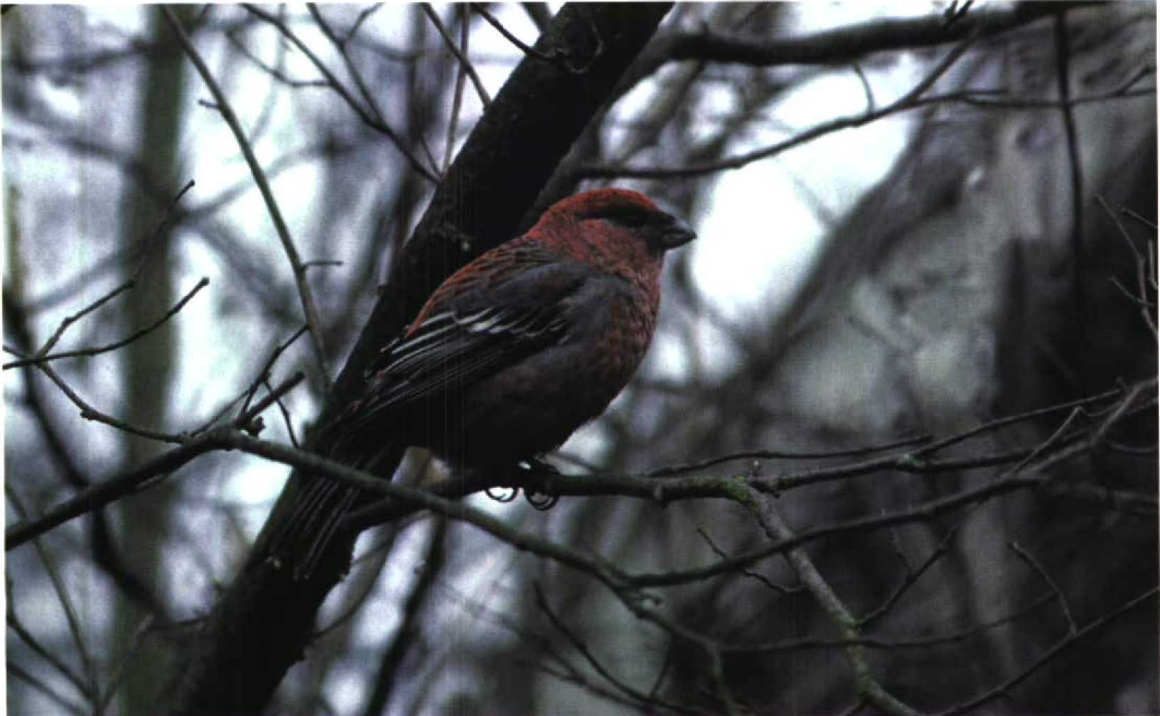
36 Haakbek / Pine Grosbeak Pinicola enucleator , Melissant, Zuid-Holland, 24 maart 1996