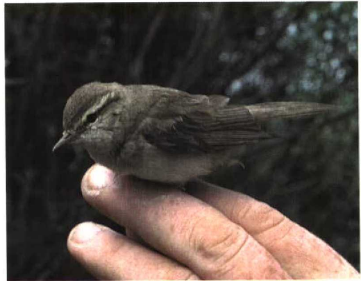
37 Fitis / Willow Warbler Phylloscopus trochilus , De Cocksdoorp, Texel, Noord-Holland, 31 mei 1995 (Ruud E Brouwer)

Het sonagram (figuur 1) laat zien dat de gewone zang van Fitis bestaat uit een serie van c 17 verschillende noten die in toonhoogte geleidelijk dalen van 5 tot 3.5 kHz (S Palmér, Radions fågel skivor, RFEF 206). Haftorn (1993) behandelde een aantal voorbeelden van mengzangers die anders dan de Texelse raadselzanger vrijwel altijd hun zang met Tjiftjaf P collybita -noten beginnen om zonder onderbreking voort te gaan