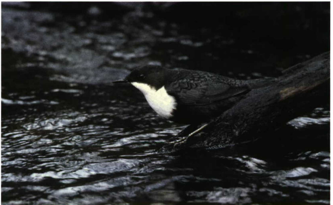
55 Waterspreeuw / Dipper Cinclus cinclus , Hierdense Beek, Gelderland, 21 januari 1998