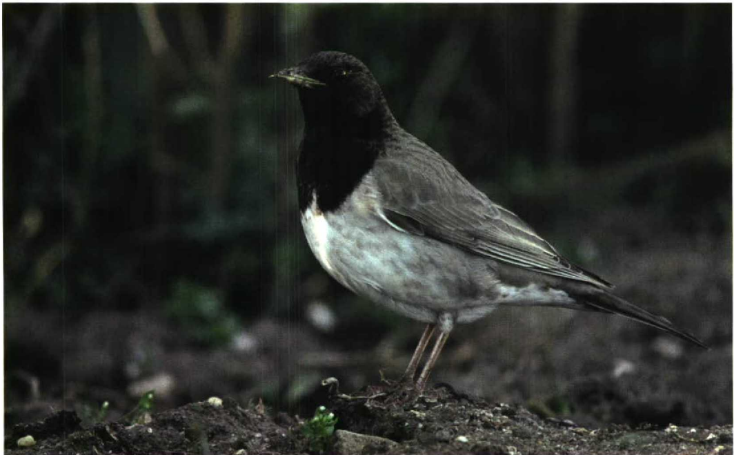
57 Zwartkeellijster / Black-throated Thrush Turdus rufigollis atrogularis , adult mannetje, West-Terschelling, Terschelling, Friesland, 12 april 1998 (Arie Ouwerkerk)