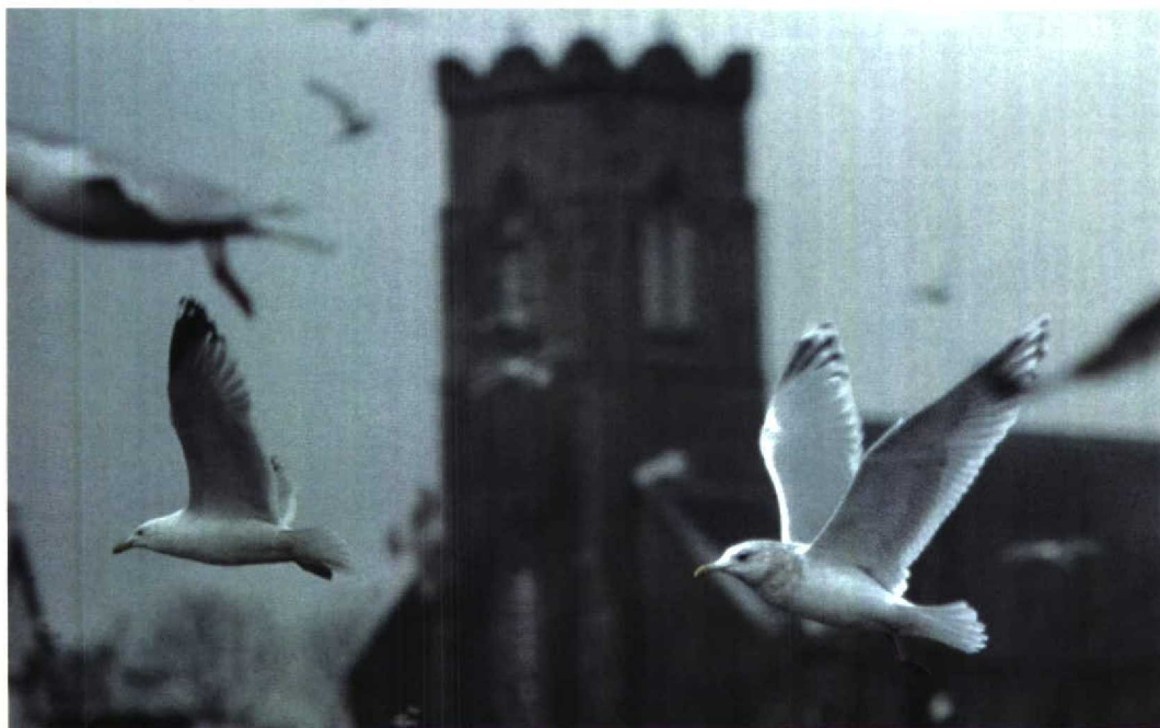
43 Thayer's Gull / Thayers Meeuw Larus glaucooides thayeri , adult, Killybegs, Donegal, Ireland, February 1998 (Anthony McGeehan)