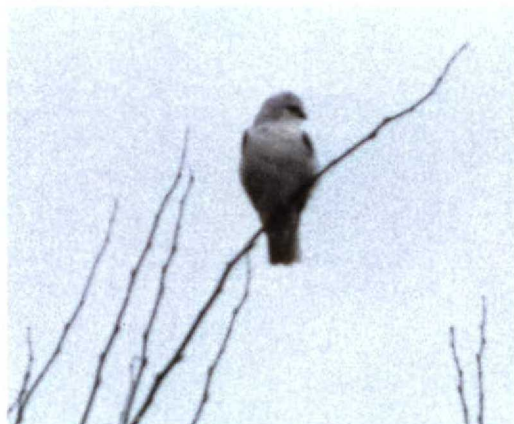
58 Grijs Wouw / Black-shouldered Kite Elanus caeruleus , adult, De Cocksdorp, Texel, Noord-Holland 30 maart 1998