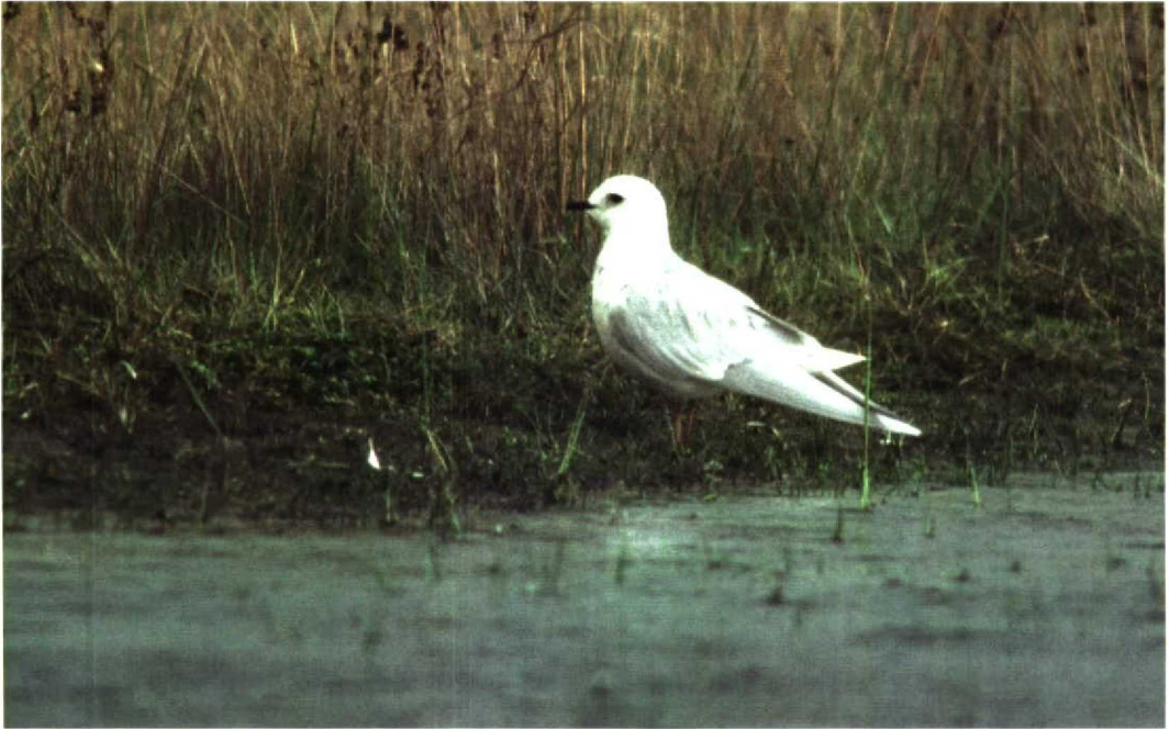
56 Ross' Meeuw / Ross's Gull Rhodostethia rosea , adult, West aan Zee, Terschelling, Friesland, 9 april 1998 (Arie Ouwerkerk)