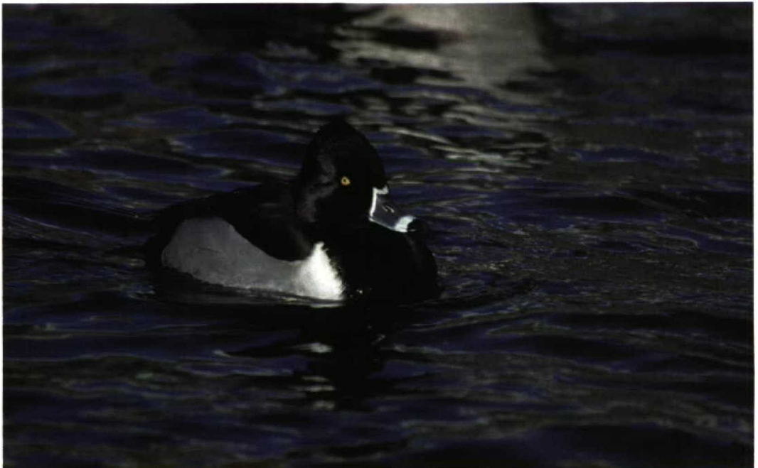
42 Ring-necked Duck / Ringsnaveleend Aythya collaris , Reykjavík, Iceland, 3 March 1998