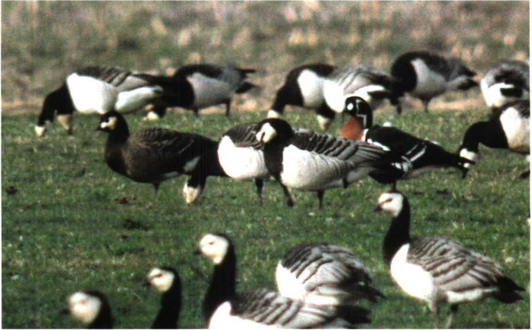
52 Roodhalsgans / Red-breasted Goose Branta ruficollis met hybride Brandgans x Roodhalsgans B leucopsis x ruficollis , Anjum, Friesland, 25 maart 1998