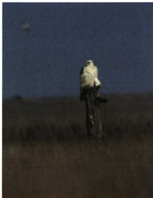
50-51 Giervalk / Gyr Falcon Falco rusticolus , onvolwassen, Schiermonnikoog, Friesland, 27 maart 1998

Holland, zag er als volgt uit: op 1 februari op de Ouderkerkerplas, op 2 februari op het Nieuwe Diep, op 3 en 8 februari weer op de Ouderkerkerplas, op 11 en 12 februari op het Kleine Nieuwe Diep en op 14 februari opnieuw op de Ouderkerkerplas. Het maximale aantal Ijseenden Clangula hyemalis langs de Brouwersdam, Zuid-Holland/Zeeland, bedroeg slechts zes op 6 februari. Amerikaanse Smienten Mareca americana verbleven van 26 tot 29 maart nabij Spaarndam, Noord-Holland, en op 27 maart in de Lauwersmeer, Groningen. Op 25 februari werden minimaal 200 Roodkeelduikers Gavia stellata geteld aan de buitenzijde van de Brouwersdam. Binnenlandwaarnemingen van Parelduikers G. arctica waren er van 29 januari tot 8 februari op de Nedereindse Plas bij IJsselstein, Utrecht, van 6 tot 11 februari ten oosten van Drachten, Friesland, van 15 tot 17 februari te Utrecht, Utrecht, en op 14 maart bij de Clausentrale te Maasbracht, Limburg. Eén tot twee Ijsduikers G. immer verbleven in februari nog langs de Brouwersdam. Noordse Stormvogels Fulmarus glacialis waren spaarzaam; langsvliegende werden gezien op 8 maart bij Westkapelle, Zeeland, en op 18 maart bij Scheveningen, Zuid-Holland. Een onvolwassen Kuifaalscholver Stictocorbo aristotelis zwom van 16 tot 19 maart tussen de havenhoofden bij Scheveningen. Tot in maart werden Kleine Zilverreigers Egretta garzetta waargenomen in de Millingerwaard, Gelderland, en twee bij het Veerse