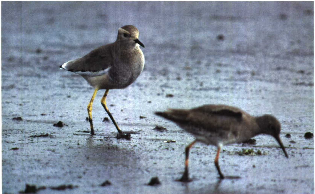
53 Witstaartkievit / White-tailed Lapwing Vanellus leucurus , Krommenie, Noord-Holland, 23 februari 1998