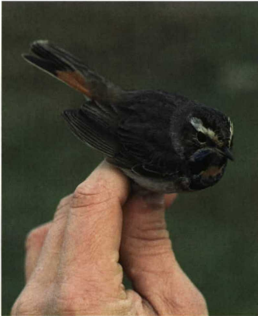
48 Red-spotted Bluethroat / Roodsterblauwborst Luscinia svecica svecica , first-summer male, Castricum, Noord-Holland, Netherlands, 9 April 1998