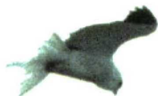
40 Black-shouldered Kite / Grijze Wouw Elanus caeruleus , adult, Grenen, Nordjylland, Denmark, 30 March 1998