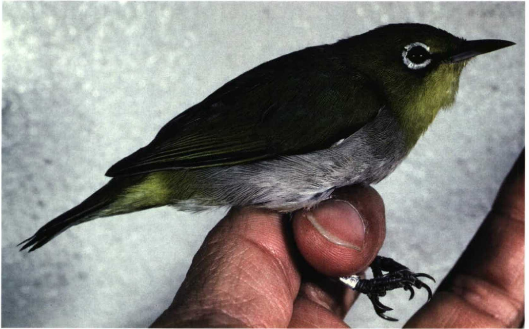
27 Japanese White-eye / Japanese Brillvogel Zosterops japonicus simplex , adult, Kadoorie, Hong Kong, China, 22 December 1990 (Yoshimitsu Shigeta)