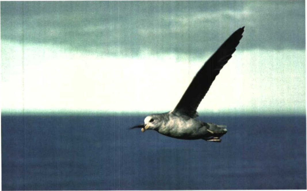
34 Fulmar / Noordse Stormvogel Fulmarus glacialis , 'double dark' morph, Sørhamna, Bjørnøya, Norway, 12 July 1980 (Jan Andries van Franeker)