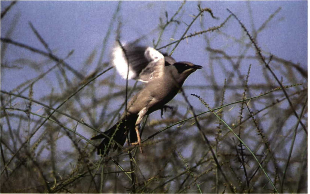
45 Grey Hypocolius / Zijdestaart Hypocolius ampelinus , Eilat, Israel, 7 April 1998