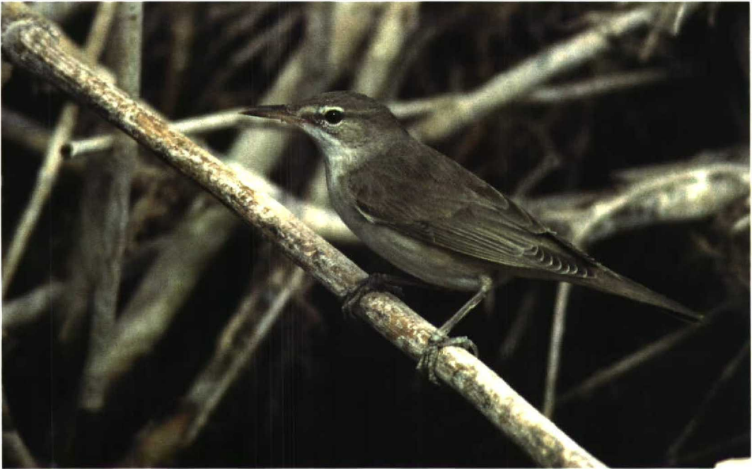
47 Basra Reed Warbler / Basrakarekiet Acrocephalus griseldis , Eilat, Israel, March 1998 (Arie Ouwerkerk)

mer Rynchops niger seen at Walvis Bay, Namibia, in February might be the first for Africa.