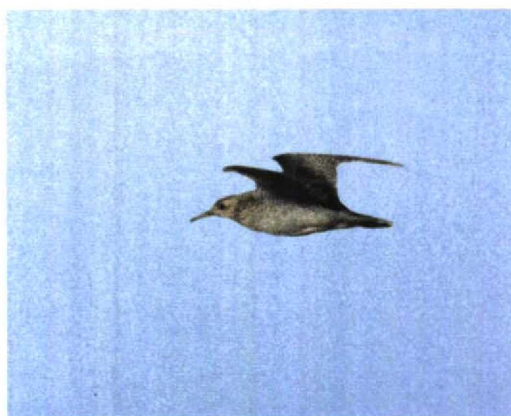
31-32 Bartrams Rooter / Upland Sandpiper Bartramia longicauda , Maasvlakte, Zuid-Holland, 28 oktober 1995

periode eind augustus tot november de broedgebieden verlaat en overwintert op de pampa's van centraal Zuid-Amerika, met name van Zuid-Brazilië tot Zuid-Argentinië. In het centrum van zijn verspreidingsgebied is het één van de meest algemene steltlopers, maar in het oostelijke deel is hij schaars en neemt hij bovendien in aantal af. Tijdens de trektijd wordt de soort vooral gezien op akkers, ruige graslanden en velden met kort gras, zoals vliegvelden en golfbanen (Hayman et al 1986).