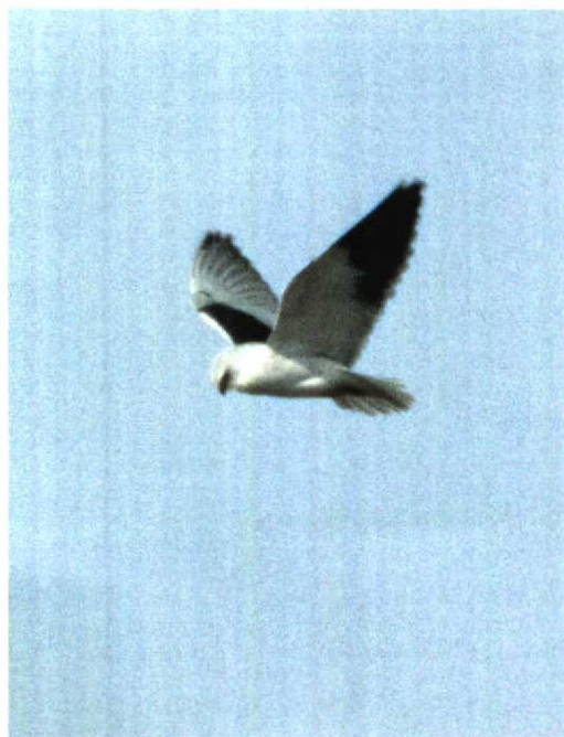
41 Black-shouldered Kite / Grijze Wouw Elanus caeruleus , adult, De Cocksdorp, Texel, Noord-Holland, Netherlands, 30 March 1998

to at least 30 March concerned (only) the sixth record for the Netherlands and the second of a white one. From 12 March onwards, a white morph was seen several times on North Uist, Western Isles, Scotland. On 5-8 April, the first twitchable white morph since 12 years for England stayed at Wembury, Devon; it also turned up at Rame Head, Cornwall. On 3-16 April, one was present at Balranald, Highland, Scotland. In Denmark, a dark morph juvenile stayed from 18 February to at least 9 April at Frederiksberg Have, København, Nordsjælland.