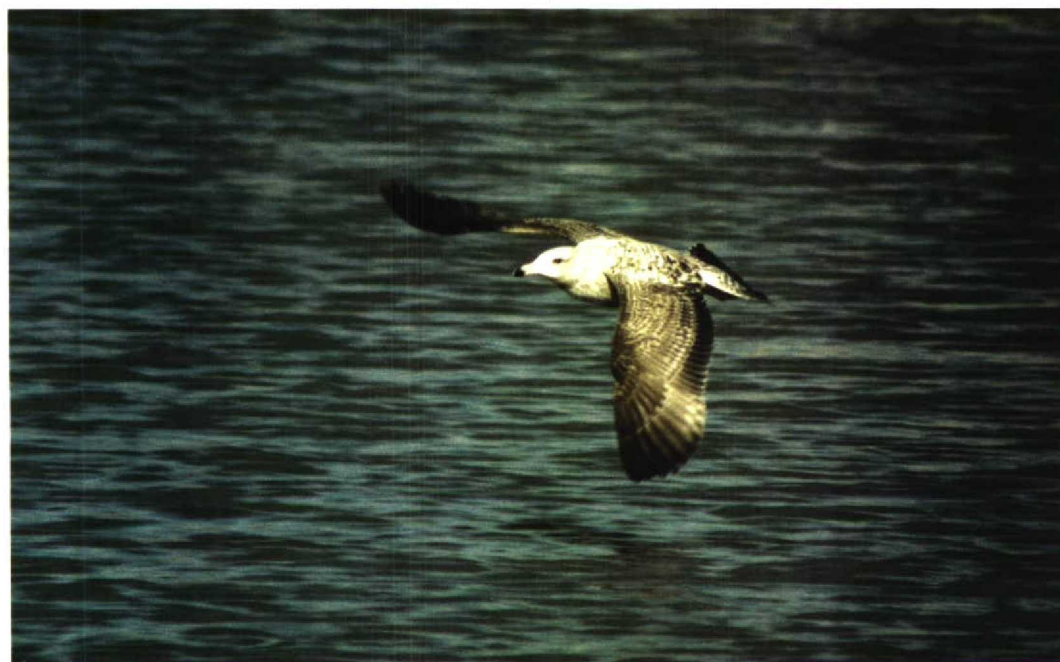
44 American Herring Gull / Amerikaanse Zilvermeeuw Larus smithsonianus , first-winter, Fishguard, Dyfed, Wales, 1 April 1998 (Tom Lowe)