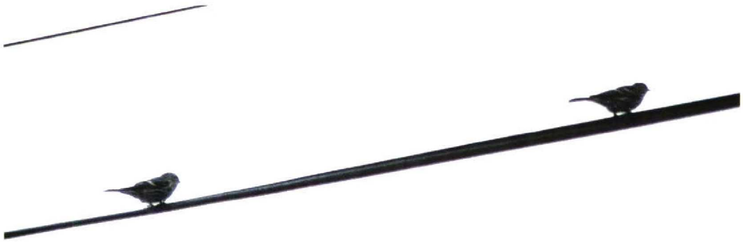
223 NW Redpoll / NW-Barmsijs Carduelis flammea rostrata/islandica and Common Chaffinch / Vink Fringilla coelebs in profile, Donegal, Ireland, September 1997 (Anthony McGeehan). Both birds at same distance from camera! Shows striking size and bulk of many NW Redpolls

the end of September but in late October there was a smaller secondary arrival. Sightings were again daily between 19 and 28 October, with a peak of at least four on 21 October. During September, almost all redpolls present on Fair Isle were NW Redpolls. There were no sightings of Mealy Redpolls during the month but up to two Lesser Redpolls were seen. The situation was more complex in October when Mealy, Lesser and NW Redpolls were all present on some days. At this time, a few redpolls were not identified to taxon.