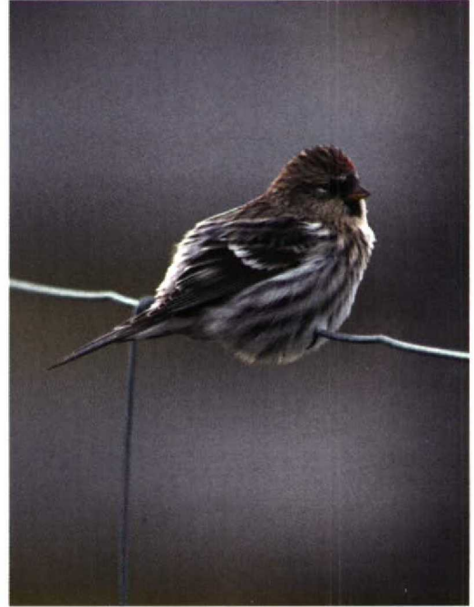
220 NW Redpoll / NW-Barmsijs Carduelis flammæ rostrata/islandica , Fair Isle, Shetland, Scotland, September 1997 ( Tim Loseby ). This individual shows to perfection triple striping on flanks. Otherwise, fairly typical individual although with rather restricted buff wash to throat and face 221 NW Redpoll / NW-Barmsijs Carduelis flammæ rostrata/islandica , Fair Isle, Shetland, Scotland, September 1997 ( Tim Loseby ). As plate 220 but this individual with stronger and more extensive buff on throat 222 NW Redpoll / NW-Barmsijs Carduelis flammæ rostrata/islandica , Fair Isle, Shetland, Scotland, September 1996 ( Roger Riddington ). One of most obvious of NW Redpolls. Huge, with deep brown mantle, dark rich buff on head and strongly marked flanks