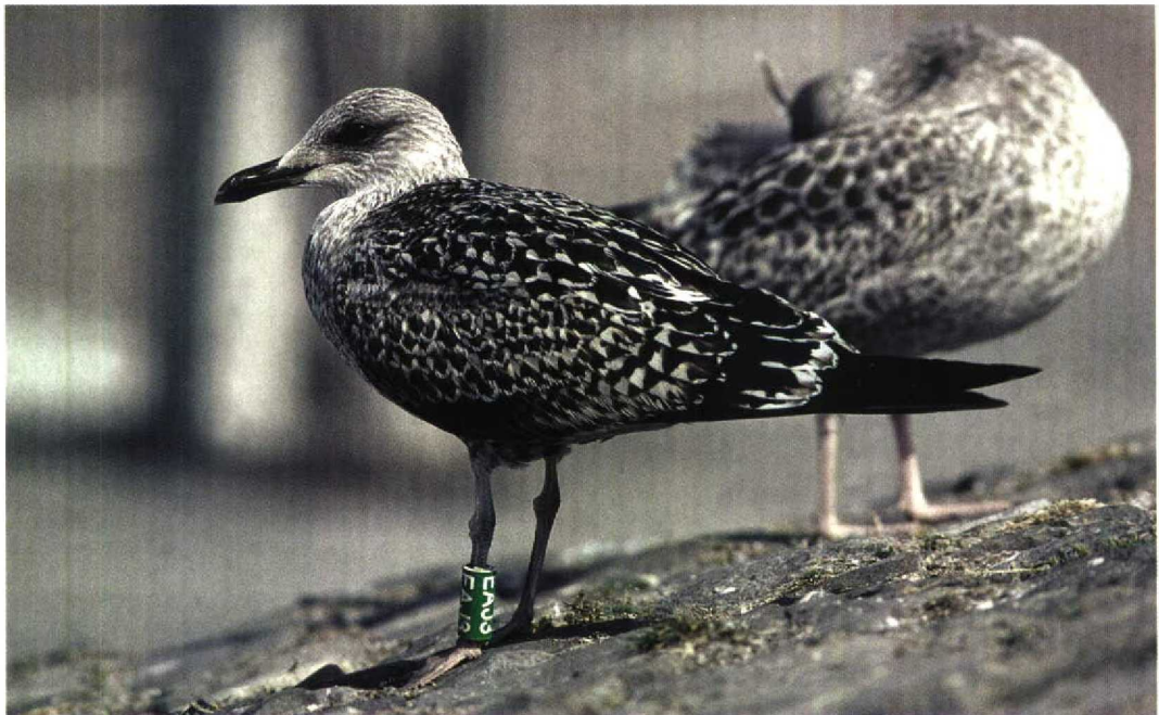
253 Lesser Black-backed Gull / Kleine Mantelmeeuw Larus graellsii , juvenile, Scheveningen, Zuid-Holland, Netherlands, 17 August 1997