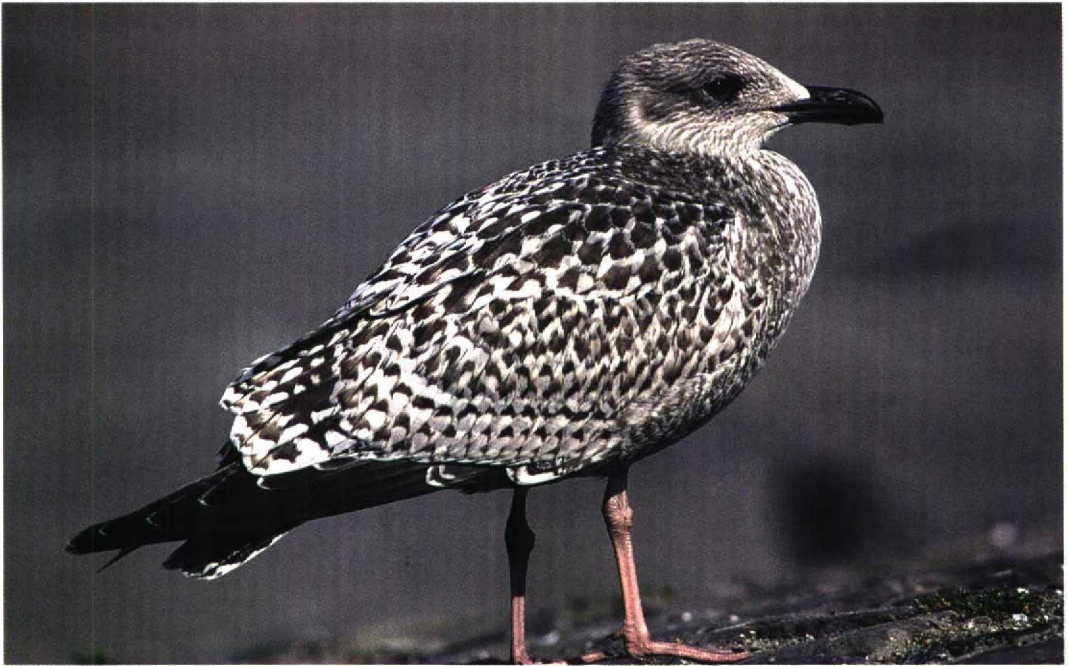
252 Herring Gull / Zilvermeeuw Larus argentatus , juvenile, Scheveningen, Zuid-Holland, Netherlands, 17 August 1997