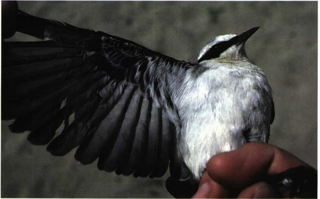
166 Northern Wheatear / Tapuit Oenanthe oenanthe , Omer Gölü, Turkey, 23 April 1987 Note dark underwing

noticeably darker than the underparts, with a sharper contrast between them. Northern always appears very contrasting and at distance the body looks bicoloured, not homogeneous as Isabelline. There have been rare reports of some very pale Northern, chiefly first-winter birds, in which such contrast is similar to that in most Isabelline, though the whole body never appears as homogeneous as in the latter species. Beware also of leucistic or aberrant, oddly coloured Northern. These