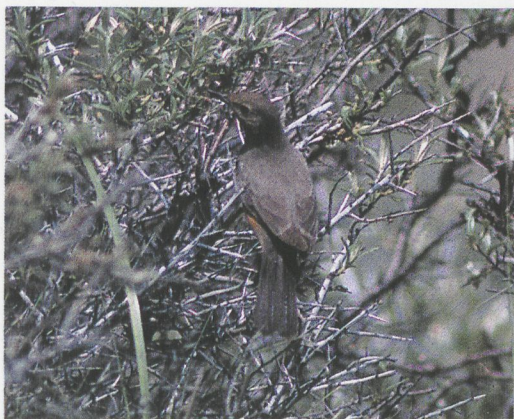
16 Perzische Roodborst / White-throated Robin Irania gutturalis , Berkheide, Wassenaar, 2 juni 1995 (Arnoud B van den Berg)