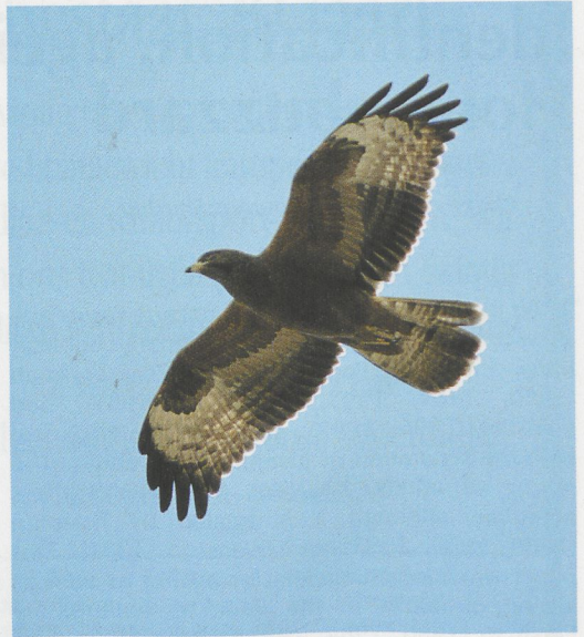
1 Honey-buzzard / Wespendif Pernis apivorus , sparsely patterned adult male, Eilat, Israel, May 1994 ( Hadoram Shirihai ). Note long 'jump' between dark trailing edge and proximal barring in remiges and rectrices, indicating male 2 Honey-buzzard / Wespendif Pernis apivorus , juvenile of most common, uniformly brownish colour morph, Chokpak, Kazakhstan, September 1993 ( Dick Forsman ). Compared with adult, note yellow cere and base of bill, dark iris and all-dark 'fingers' at wing-tip, as well as differently spaced barring of remiges. Dark birds typically show uniformly brownish median and lesser coverts and pale greyish greater coverts 3 Honey-buzzards / Wespendif Pernis apivorus , adult female (left) and adult male at nest, southern Finland, 28 July 1979 ( Dick Forsman ). Note more uniform upperparts and greyer head of male