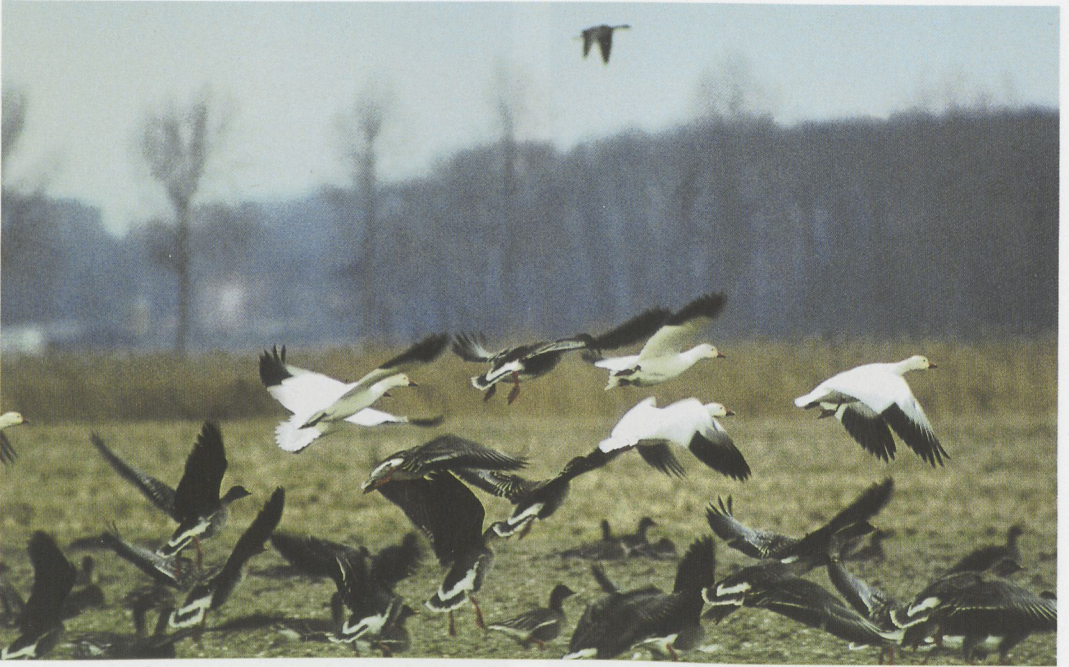
39 Sneeuwganzen / Snow Geese Anser caerulescens , Urk, Noordoostpolder, Flevoland, 4 januari 1997 (Piet Munsterman)