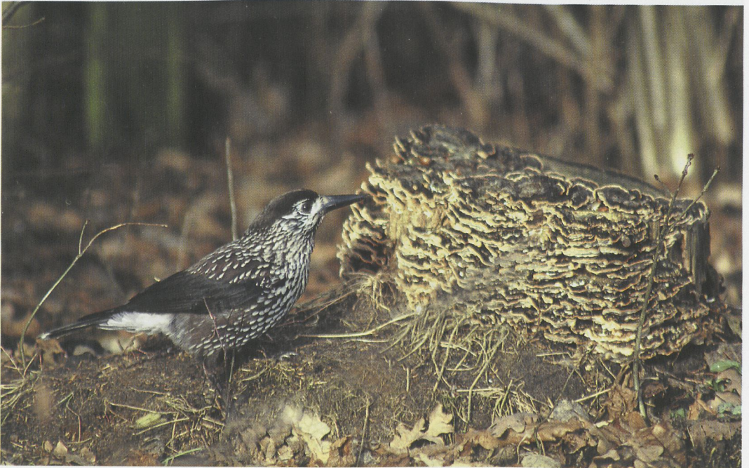
40 Notenkraaker / Nutcracker Nucifraga caryocatactes , Veenwouden, Friesland, januari 1997