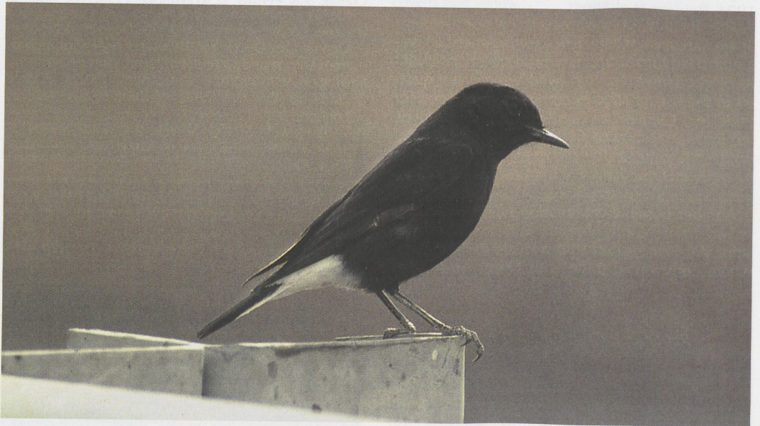
19 'Basalt Wheatear' (black morph of Middle Eastern subspecies of Mourning Wheatear) / 'Basalttapuit' (zwarte vorm van Midden-Oostenondersoort van Rouwtapuit) Oenanthe lugens lugens , As Safawi, Jordan, 7 April 1996

A few birds of the typical morph of Mourning Wheatear have been seen within the breeding range of Basalt Wheatear, although they are very scarce in the basalt desert (Andrews 1994). The typical morph normally prefers chalk cliffs and shrubland (Wallace 1983b). Cramp (1988) men-