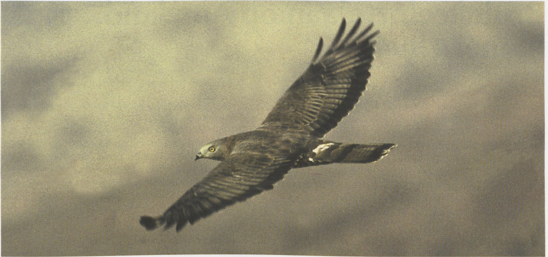
11 Honey-buzzard / Wespendifief Pernis apivorus , adult male, Eilat, Israel, May 1994 ( Hadoram Shirihai )

birds in their care. Special thanks also to the staff members of all zoological museums we have visited over the past years. Dave Mc Adams clarified several points in an earlier draft for which we both are most grateful. Further, HS is grateful to the International Birdwatching Center in Eilat, the Raptor Information Center (of SPNI) and the Nature Reserves Authority for considerable financial support, enabling a total of 11 full seasons of raptor migration surveys in Eilat, Kfar Qasim and the Northern Valleys in Israel.