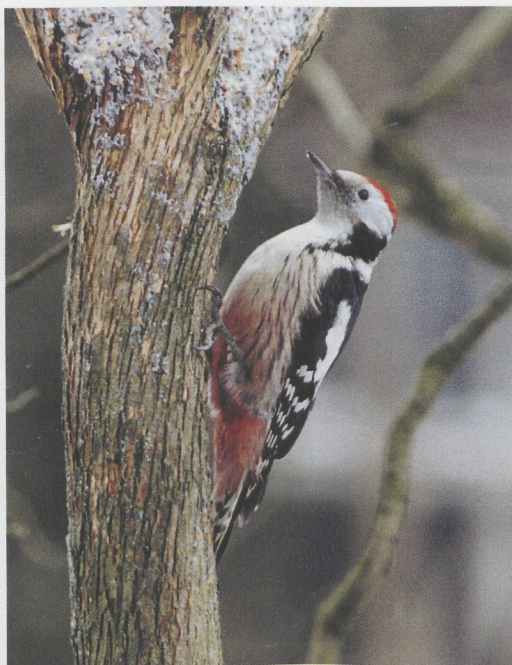
41-42 Middelste Bonte Specht / Middle Spotted Woodpecker Dendrocopos medius , Heeze, Noord-Brabant, 11 januari 1997

Grasmus Sylvia undata voor Nederland, en de tweede binnen ruim een jaar tijd, verbleef van 3 tot 7 januari op de Brielsegatdam tussen het Oostvoornse Meer en de Westplaat, Zuid-Holland. Deze vogel, een mannetje, liet zich in tegenstelling tot de vogel in 1995 goed observeren. Een late Pallas' Boszanger Phylloscopus proregulus zat op 7 december nog bij Breezanddijk op de Afsluitdijk, Friesland. Buiten Limburg werden Taiga-boomkruipers Certhia familiaris waargenomen op 17 december in Houten, Utrecht, in de laatste dagen van december op Terschelling, Friesland, op 28 en 29 december in Doesburg, Gelderland, en op 18 januari op