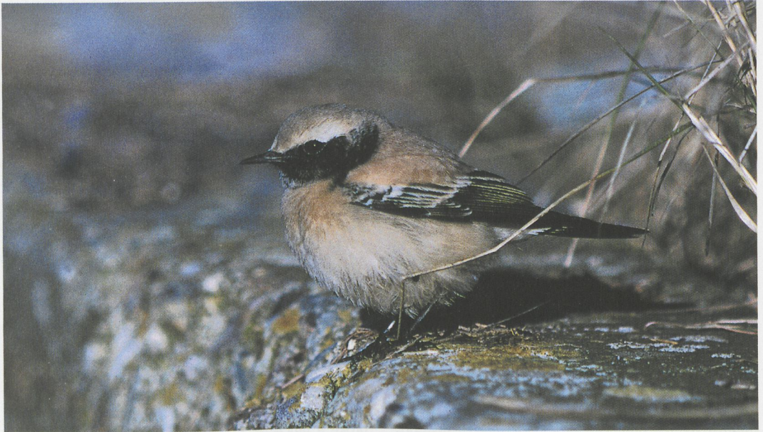
49 Woestijntapuit / Desert Wheatear Oenanthe deserti , Westernieland, Groningen, 23 december 1996

ende (acht); en te Dendermonde. Op 8 december was een ongedetermineerde burgemeester Larus aanwezig bij Wuustwezel, Antwerpen. Op 16 januari verbleef een Kleine Burgemeester L. glaucooides op de Maas bij Huy, Liège. Op 21 december vloog een eerste-winter Grote Burgemeester L. hyperboreus langs Lier-Duffel. Nog een eerste-winter was op 29 december aanwezig te Oostende en een derde-winter vloog op 22 januari over het strand te Middelkerke. Op 18 januari werd een dode Kleine Alk Alle alle opgeraapt te Bredene; van drie andere vondsten werden geen datums ontvangen. Bij Teuven in de Voerstreek, Limburg, verbleef op 8 januari een Middelste Bonte Specht Dendrocopos medius . Van de 23 gemelde Strandleeuweriken Eremophila alpestris bestonden de grootste groepen uit 15 te Knokke-Zwin en 12 te Zeebrugge-Achterhaven. Op 14 december was een Rouwkwikstaart Motacilla alba yarellii aanwezig te Langerbrugge, Oost-Vlaanderen. Op 1 december werd kortstondig een Pestvogel Bombycilla garrulus gezien te Herentals, Antwerpen, en op 18 december was er zowel een aanwezig bij Antwerpen als te Oostende. Van 2 tot 5 december verbleef een Pallas' Boszanger Phylloscopus proregulus in Het Zwin te Knokke. De Klapeksters Lanius excubitor te Kruikebeke-polder, Oost-Vlaanderen, en te Brecht-Schietveld, Antwerpen, bleven nog de gehele periode aanwezig. Verder waren er waarnemingen te Viersel, Antwerpen, en bij de Barrages de la Plate-Taille,