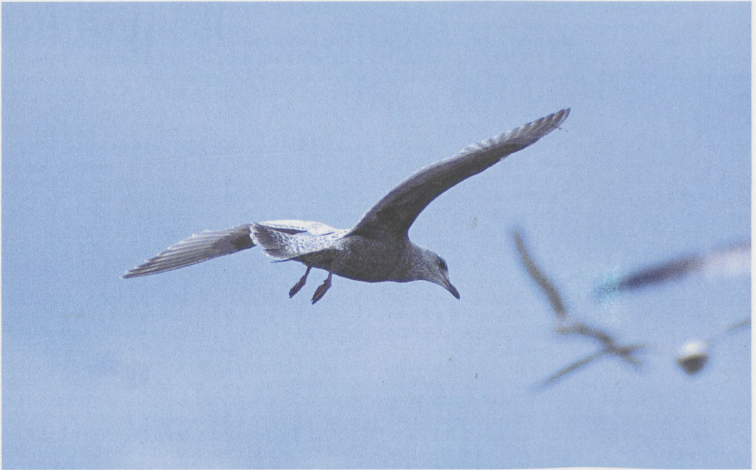
50 Thayer's Gull / Thayers Meeuw Larus (glaucoides) thayeri , first-winter, Belfast, Antrim, Northern Ireland, 1 March 1997

rest, the bird looked 'odd & unique' and differed as much from Iceland Gull as it did from Herring Gull. In many ways, it more closely resembled a small first-winter smithsonianus with frosty upperparts and unusual primaries, which were dark brown with chevron-like pale fringes. In flight, the critical features were the bird's plain and smooth tail band which covered all but the bases of the outermost tail feathers (again, like a smithsonianus : though less blackish-brown in colour). The end of the tail was tipped pale, and the uppertail coverts were closely barred: all of which emphasised the tail's dark band. Each of the outer group of primaries was dark brown (almost, but not quite as dark as in a Herring Gull) on the outer web but pale on the inner. The tips of these feathers were more extensively dark