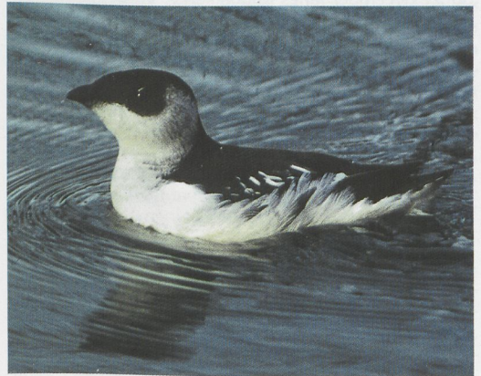
43 Middelste Bonte Specht / Middle Spotted Woodpecker Dendrocopos medius , Epen, Limburg, 22 december 1996 44 Middelste Bonte Specht / Middle Spotted Woodpecker Dendrocopos medius , Ter Apel, Groningen, 26 december 1996 45 Provençaalse Grasmus / Dartford Warbler Sylvia undata , Brielsegatdam, Zuid-Holland, 6 januari 1997 46 Izabelklauwier / Isabelline Shrike Lanius isabellinus phoenicuroides , Lauwersoog, Friesland, 11 december 1996 47 Zwarte Rotgans / Black Brant Branta nigricans , adult, Stroe, Wieringen, Noord-Holland, 8 februari 1997 48 Kleine Alk / Little Auk Alle alle , Kanaal Almelo-Nordhorn, Overijssel, 16 november 1996 (cf Dutch Birding 18: 332, 1996)