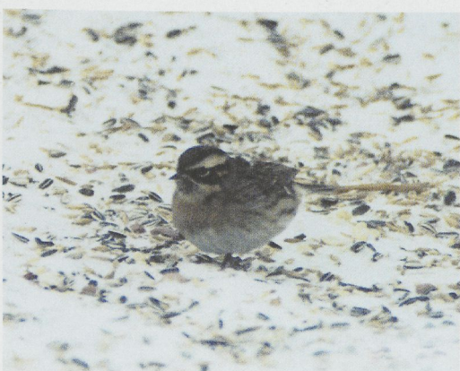
27 Caspian Yellow-legged Gull / Kaspische Geelpootmeeuw Larus cachinnans cachinnans , Etaples, Pas-de-Calais, France, 1 February 1997 (Anthony McGeehan) 28 American Herring Gull / Amerikaanse Zilvermeeuw Larus argentatus smithsonianus , first-winter, Belfast, Antrim, Northern Ireland, 15 February 1997 (Anthony McGeehan) 29 Pied-billed Grebe / Dikbekfuut Podilymbus podiceps , South Norwood, Greater London, England, February 1997 (Steve Young/Birdwatch) 30 Little Bittern / Woudaap Ixobrychus minutus , Quinta do Lago, Algarve, Portugal, 1 February 1997 (Ray Tipper) 31 Buff-bellied Pipit / Amerikaanse Waterpieper Anthus rubescens , Träslövsläge, Halland, Sweden, January 1997 (Michael Bergman) 32 Black-throated Accentor / Zwartkeelheggenmus Prunella atrogularis , Pieksämäki, Finland, February 1997 (Harry J Lehto)