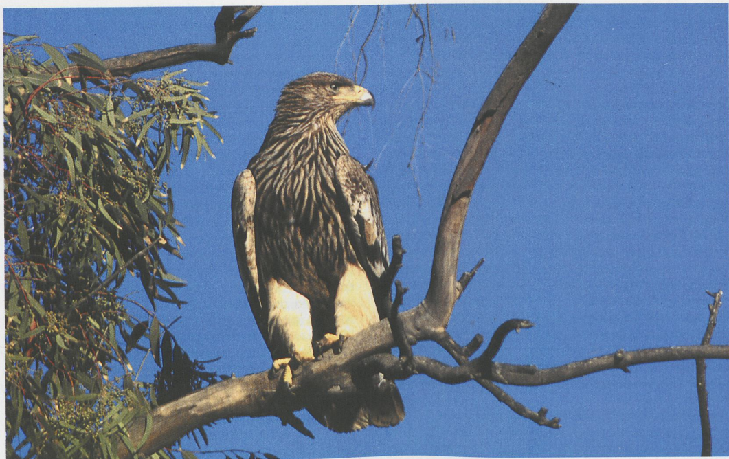
24 Imperial Eagle / Keizerarend Aquila heliaca , juvenile, north-western Negev, Israel, January 1997 (Hadoram Shirihai)

Brown Boobies Sula leucogaster were staying at North Beach, Eilat, in February. In northern Greece, 170 Dalmatian Pelicans Pelecanus crispus were counted at Porto Lagos in late December-January and 35 at Karatza lagoon. In Portugal, two Little Bitterns Ixobrychus minutus were seen regularly, presumably wintering, at Quinta do Lago, Algarve, from December to at least 4 February. A Squacco Heron Ardeola ralloides stayed near Cagliari, Sardinia, Italy, during January-February and another was in Ebro delta, Catalonia, Spain. Also in Spain, 47 Glossy Ibises Plegadis falcinellus were counted at El Rocio, Coto Doñana, on 27 December. In the Canary Islands, a first-winter Greater Flamingo Phoenicopterus roseus at Roquito del Fraile on 16 November was the first for Tenerife; the bird had an aluminium and a colour-ring from Fuente de Piedra, Andalucía, Spain (contra Birding World 10: 10, 1997).