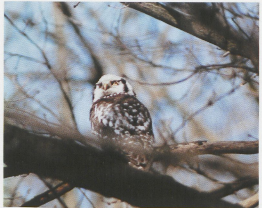
14-15 Sperweruil / Hawk Owl Surnia ulula , Brunssum, Limburg, 2 april 1995 (Hans van de Laar)