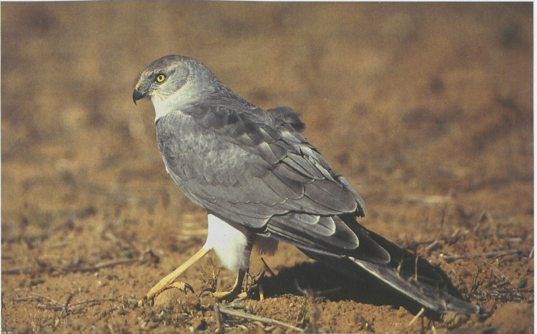
25 Pallid Harrier / Steppekiekendief Circus macrourus , adult male, north-western Negev, Israel, December 1996

Eagles Circaetus gallicus were wintering in the Kouklia area; another stayed in mid-winter near Rome, Latium, Italy. Two wintering Spotted Eagles Aquila clanga were reported from Switzerland in the first half of January. Seven were reported during February in France, of which five in the Camargue, Bouches-du-Rhône, one at St-Martin-de-Seignanx, Landes, from 2 January onwards and one at Étang de Lindre, Moselle, from 24 January onwards. More than 10 were wintering in northern and central Italy, which is more than ever before. During the national winter raptor census in Israel in December 1996-January 1997, at least 60 were counted in Hula valley. The second Tawny Eagle A rapax for Israel was one seen on 22 November in north-western Negev. In Sweden, a third-year Steppe Eagle A nipalensis remained from 21 December into February at Lindhult, Halland; in Finland, one was reported at Kemijärvi on 11 January. The winter census in Israel showed that 35 Imperial Eagles A heliaca were wintering in north-western Negev (besides, 23 were reported from the Hula valley); other good counts in the north-western Negev included 15 Pallid Harriers Circus macrourus , seven Saker Falcons Falco cherrug , and 19 Sociable Lapwings Vanellus gregarius . Two adult Verreaux's Eagles A verreauxii were seen at Wadi Shlomo near Eilat on 21 February. The third Merlin F columbarius for the Canary Islands was seen at Arguayo, Tenerife, on 28 January.