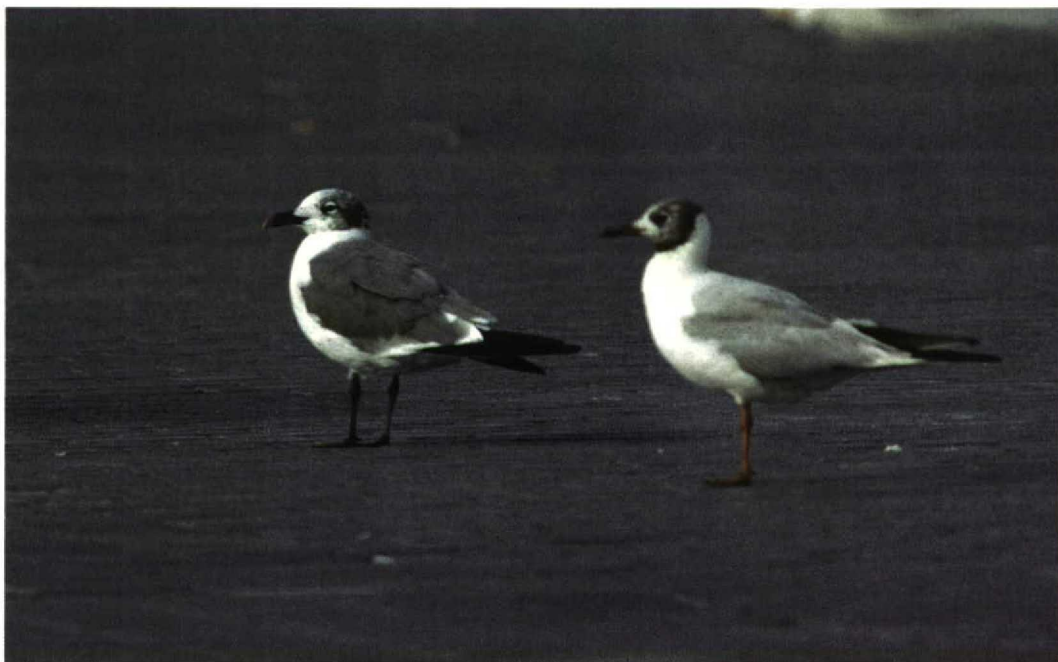
220 Lachmeeuw / Laughing Gull Larus atricilla , Groningen, Groningen, 22 augustus 1997 (Eric Koops)

Na het nieuws via de semafoons te hebben verspreid arriveerden de eerste verhitte Groningers, sommigen in nogal ongewone outfit, op de plek. Pas na een half uur vloog de Lachmeeuw weer over. Toen de eerste mensen 'uit het land', getergd door files, arriveerden, liep het al tegen vijven. De vogel was al uren zoek, nadat hij nog even bij een sluis c 800 m verderop was gezien. Maar gelukkig vloog hij om c 17:30 opnieuw