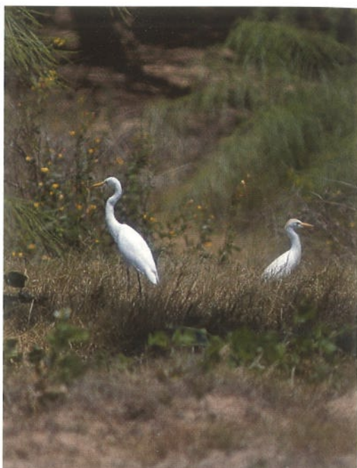
86 Hawk Owl / Sperweruil Surnia ulula , Gribskov, Sjælland, Denmark, March 1996 87 Intermediate Egret / Middelste Zilverreiger Egretta intermedia and Cattle Egret / Koereiger Bubulcus ibis , Rabil Lagoon, Boavista, Cape Verde Islands, 22 March 1996 88 Sociable Lapwing / Steppekievit Chettusia gregaria , Lopik, Utrecht, the Netherlands, April 1996