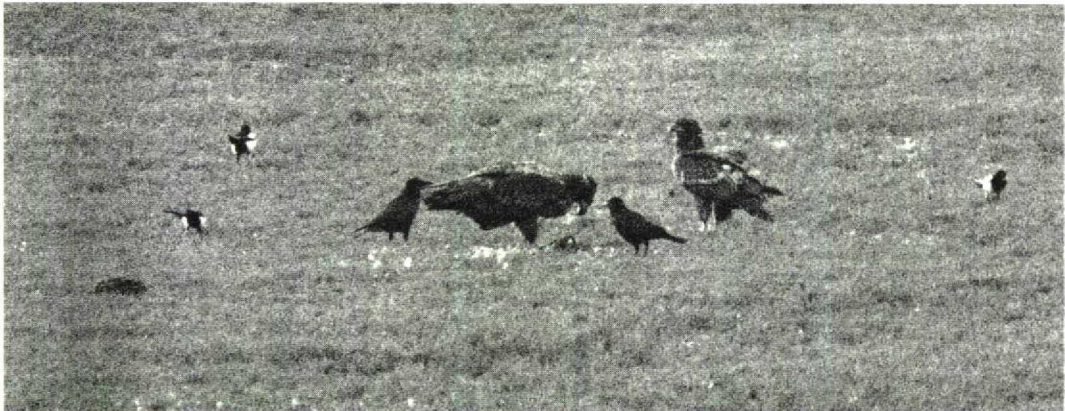
93 Zeearenden / White-tailed Eagles Haliaeetus albicilla , Hellegatsplaten, Zuid-Holland, 13 januari 1996

KRAANVOGELS TOT ALKEN In de periode vanaf 16 februari werden c 4000 Kraanvogels Grus grus geteld, met als piekperiode 8 tot 14 maart (3700). Een mannetje Kleine Trap Tetrao tetrao verbleef van 19 tot 27 maart bij de Inlagen van Westenschouwen, Zeeland. De Grote Trap Otis tarda van Rolde, Drenthe, was daar nog aanwezig tot 9 maart, terwijl er op 20 februari één langsvloog bij Kijkduin, Zuid-Holland. Groot was de verbazing toen op de plek van de Kleine Trap bij Westenschouwen van 30 maart tot 1 april een Griël Burhinus oediacnemus opdook. Deze vogel had een rode ring aan de rechterpoot en is waarschijnlijk afkomstig van de Engelse populatie waarvan veel vogels geringd zijn. Recordaantallen Goudplevieren Pluvialis apricaria (34 000) en Kieviten Vanellus vanellus (110 000) werden op 21 maart geteld bij Breskens. Een Steppekievit Chettusia gregaria verbleef vanaf 3 april bij Lopik. De eerste Ijslandse Grutto's Limosa limosa islandica werden gemeld op 31 maart (vijf) bij de Flaauwers Inlaag, Zeeland. Rosse Franjepoten Phalaropus fulicaria werden waargenomen op 17 februari bij Lauwersoog en op 20 februari bij Katwijk, Zuid-Holland. Kleine Burgemeesters Larus glaucooides werden gezien op 11 februari bij Ool, Limburg, op 18 februari in De Putten bij Camperduin en langs de Maas bij Waalwijk, Noord-Brabant, op 28 februari bij Katwijk en op 29 februari bij