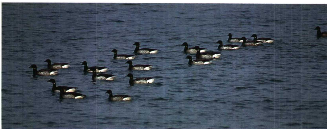
31 Provençaalse Grasmus / Dartford Warbler Sylvia undata , Westkapelle, Zeeland, 1 december 1995 (Erik Sanders) 32 Dwerggors / Little Bunting Emberiza pusilla , Katwijk, Zuid-Holland, 25 december 1995 (René van Rossum) 33 Humes Bladkoning / Hume's Yellow-browed Warbler Phylloscopus humei , Den Haag, Zuid-Holland, 29 december 1995 (Peter van Rij) 34 Witstuitbarmsijs / Arctic Redpoll Carduelis hornemanni exillipes , Lopik, Utrecht, 5 februari 1996 (Roel Mulder) 35 Witbuikrotganzen / Pale-bellied Brent Geese Branta bernicla hrota , Neeltje Jans, Zeeland, 2 januari 1996 (Peter L. Meiningier)