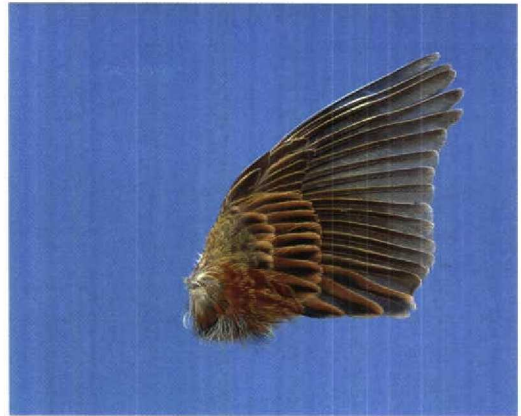
12 Cirlgors / Cirl Bunting Emberiza cirlus , tweede-kalenderjaar mannetje (gevonden te Hoogerheide, Noord-Brabant, 13 maart 1995), Zoologisch Museum Amsterdam, Noord-Holland, juni 1995

van den Berg, A B & Bosman, C A W 1996. Lijst van