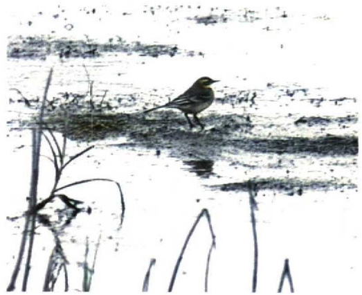
56 Citroenkwikstaart / Citrine Wagtail Motacilla citreola , Eemshaven, Groningen, 5 september 1994

Dit is het vierde geval voor Nederland. Voor een overzicht van de overige Nederlandse geval-