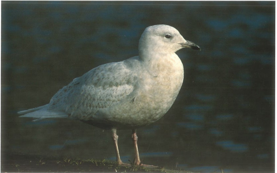
68 Kleine Burgemeester / Iceland Gull Larus glaucooides , eerste-winter, Groningen, Groningen, 9 maart 1995 (Eric Koops)