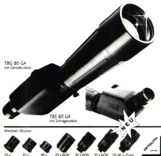
TBG 80 GA mit Geradenblick