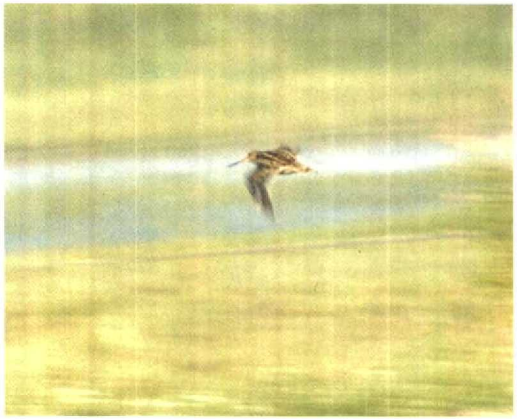
127 Poelsnip / Great Snipe Gallinago media , juveniel, Workumerwaard, Friesland, 31 juli 1994

Hayman et al 1986). Het geluid en gedrag ondersteunen de determinatie. Voor verschillen met andere snipsoorten, zoals Stekelstaartsnip G. stenura , Siberische Snip G. megala en 'Amerikaanse Watersnip' G. (g) delicata (die alle drie een geheel gebandeerde ondervleugel hebben en in Westeuropa als dwaalgast kunnen voorkomen), wordt verwezen naar van Spanje et al (1995) en de daarin genoemde verwijzingen. Het feit dat de lichte vleugelstrepen op de bovenzijde relatief smal waren (zowel in zit als in vlucht) en de bandering op de buitenste staartpennen duiden op een juveniele vogel. Adulte Poelsnippen hebben veel bredere witte toppen aan de dekveren en daardoor meer opvallende en wittere vleugelstrepen en ongetekende witte buitenste staartpennen. Eerstejaars vogels krijgen deze vleugeltekening in november-december; in januari ruien de buitenste staartpennen naar volledig witte pennen en vanaf die tijd zijn onvolwassen vogels niet of nauwelijks meer te onderscheiden van adulte. De aanvaarding door de Commissie Dwaalgasten Nederlandse Avifauna (CDNA) van een Poelsnip bij Opheusden, Gelderland, op 12 januari 1980 als tweede-kalenderjaar is derhalve curieus en verdient heroverweging (cf Blankert & CDNA 1982).