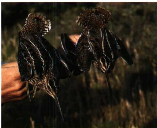
89 Poelsnip / Great Snipe Gallinago media , juveniel, Zandvoort, Noordholland, 26 juli 1994