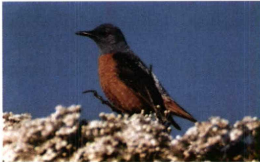
94 Audouin's Gull / Audouins Meeuw Larus audouinii , second-summer, Boulogne-sur-Mer, Pas-de-Calais, France, 24 June 1995 95 Rock Thrush / Rode Rotslijster Monticola saxatilis , male, Holme, Norfolk, May 1995 96 Red-headed Bunting / Bruinkopgors Emberiza bruniceps , male, Slikken van de Heen, Zeeland, 2 June 1995 97 Rufous Scrub-robin / Rosse Waaijerstaart Cercotrichas galactotes , Pyhtää Ristisaari, Finland, 27 May 1995