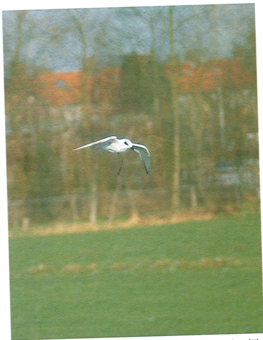
26 Forsters Stern / Forster's Tern Sterna forsteri , Kinderdijk, Zuidholland, 5 januari 1995 (Piet van Meerkerk)