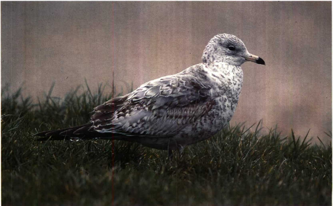
53 Ring-billed Gull / Ringsnavelmeeuw Larus delawarensis , Greatstone-on-Sea, Kent, England, January 1994