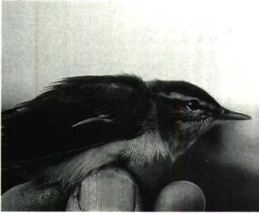
45 Roodoogvireo / Red-eyed Vireo Vireo olivaceus , Vlieland, Friesland, 24 september 1991 (Kees Terpstra)