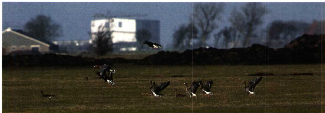
61 Dwergganzen / Lesser White-fronted Geese Anser erythropus , groep van zes, Ferwoude, Friesland, 30 januari 1994 62 Kleine Canadese Gans / Lesser Canada Goose Branta canadensis ssp, Wonneburen, Friesland, 30 januari 1994