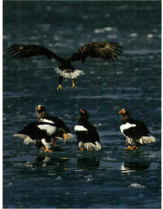
37 Blakiston's Fish Owl / Blakistons Visuil Ketupa blakistoni , Hokkaido, Japan 38 Steller's Sea Eagles / Stellers Zeearenden Haliaeetus pelagicus and White-tailed Eagle / Zeearend H albicilla , Shiretoko, Hokkaido, Japan 39 Bonin Islands Honeyeater / Boninhoningeter Apalopteron familiare , Haha-jima, Ogasawara Islands, Japan, June 1987 40 Ryukyu Robin / Ryukyuroodborst Erithacus komadori , Ryukyu, Japan, 29 January 1984