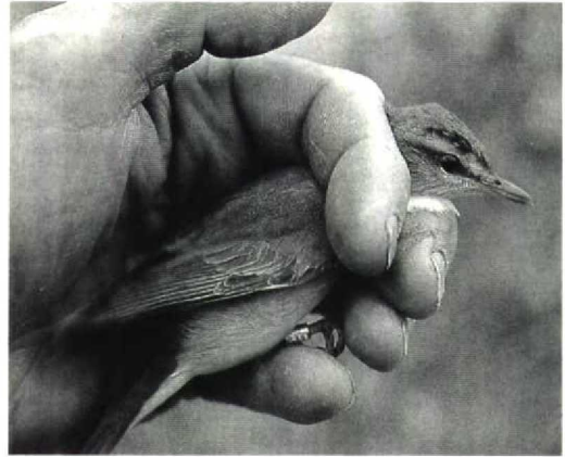
46 Roodoogvireo / Red-eyed Vireo Vireo olivaceus , Vlieland, Friesland, 2 oktober 1991

Op 2 oktober 1991 werden op dezelfde plek door KT tussen 08:45 en 17:00 34 vogels gevangen en geringd, waaronder verbazend genoeg opnieuw een Roodoogvireo (ring Arnhem B833381). Ook deze vogel behoorde tot de ondersoort V o olivaceus . De beschrijving van verenkleed en naakte delen en de vleugelformule van deze vogel komen overeen met het exemplaar van 24 september. De maten waren echter verschillend: vleugel 79 mm, snavel 15 mm, staart 47 mm, tarsus 19.5 mm, afstand snavelpunt tot achterzijde kop 33.5 mm, lengte 148 mm, gewicht 18.5 g. De staartpunten waren spits en rafelig. Op grond hiervan werd dit exemplaar gedetermineerd als eerstejaars. Omdat een tweedejaars-vogel altijd geheel geruide staartpennen heeft (met ronde top) kan in dit geval met zekerheid worden gesteld dat de vogel een eerstejaars betrof (Kees Roselaar in litt). De bruinrode oogkleur en de lichtgele zweem op de onderstaartdekveren ondersteunen deze leeftijdsbepaling. De vleugellengte van 79 mm duidt op een vrouwtje.