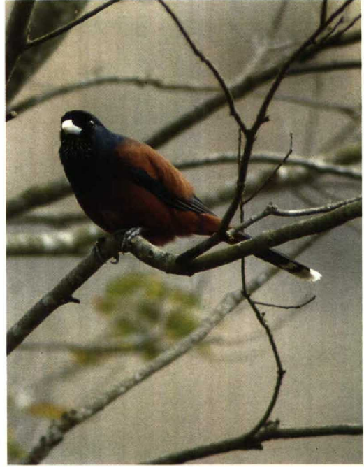
33 Baer's Pochard / Baers Witoogeend Aythya baeri , Ukima Park, Tokyo, Japan, 3 March 1994 (Enno B Ebels) 34 Lidth's Jay / Lidths Gaai Garrulus lidthi , Amami-oshima, Japan, 11 March 1983 (Mamoru Tsuneda/Images of Japan) 35 Latham's Snipe / Japanese Snip Gallinago hardwickii , Hokkaido, Japan, June 1984 (Mark Brazil/Images of Japan) 36 Amami Woodcock / Amamihoutsnip Scolopax mira , Nansei Shoto, Japan (Mark Brazil/Images of Japan)