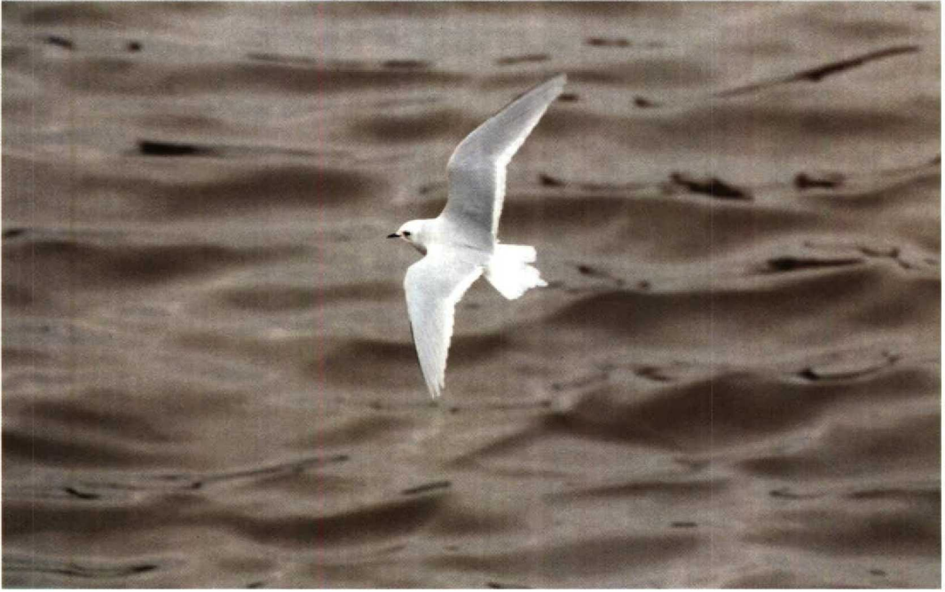
52 Ross's Gull / Ross' Meeuw Rhodostethia rosea , Sunderland, Tyne and Wear, England, March 1994