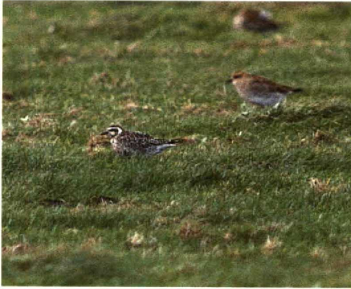
41 Amerikaanse Goudplevier / American Golden Plover Pluvialis dominica , Texel, Noordholland, oktober 1989