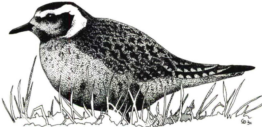
FIGUUR 1 Amerikaanse Goudplevier / American Golden Plover Pluvialis dominica , Texel, Noordholland, oktober 1989 (Gerald Driessens)

ONDERDELEN Borst vlekkerig grijsbruin. Kin en middelste deel van keel zwart gevlekt, overgaand in grijze hals en borst. Zijkant van keel wittig met vanaf snavelbasis uitwaaiierende donkere streepjes. Witte wenkbrauwstreep achter oog scherp omknikkend naar beneden en verbredend, naar beneden als vage lichte baan doorlopend en ter hoogte van vleugelboeg afbuigend