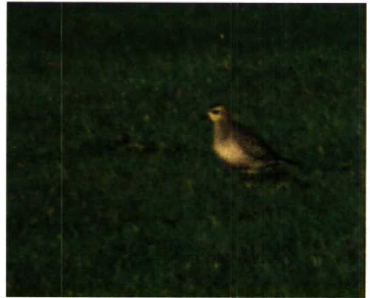
42 Amerikaanse Goudplevier / American Golden Plover Pluvialis dominica , Stavoren, Friesland, 19 november 1989

naar borst. Flank grijswit tot bruinwit met donkere vlekjes en schubjes, overgaand in zwarte middenbuik. Op verse geruide (lichte) winterkleedveren geen geel zichtbaar. Onregelmatige tekening en overgang van zwarte buik naar flanken enigszins lijkend op buiktekening van Kolgans Anser albifrons . Zwart tot op onderbuik doorlopend. Anaalstreek en onderstaartdekveren wit met aan één zijde geïsoleerd zwart vlekje op onderstaartdekveren.