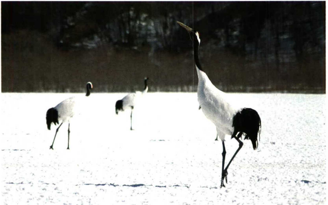
32 Japanese Crane / Chinese Kraanvogel Grus japonensis , Kushiro, Hokkaido, Japan, 5 March 1994