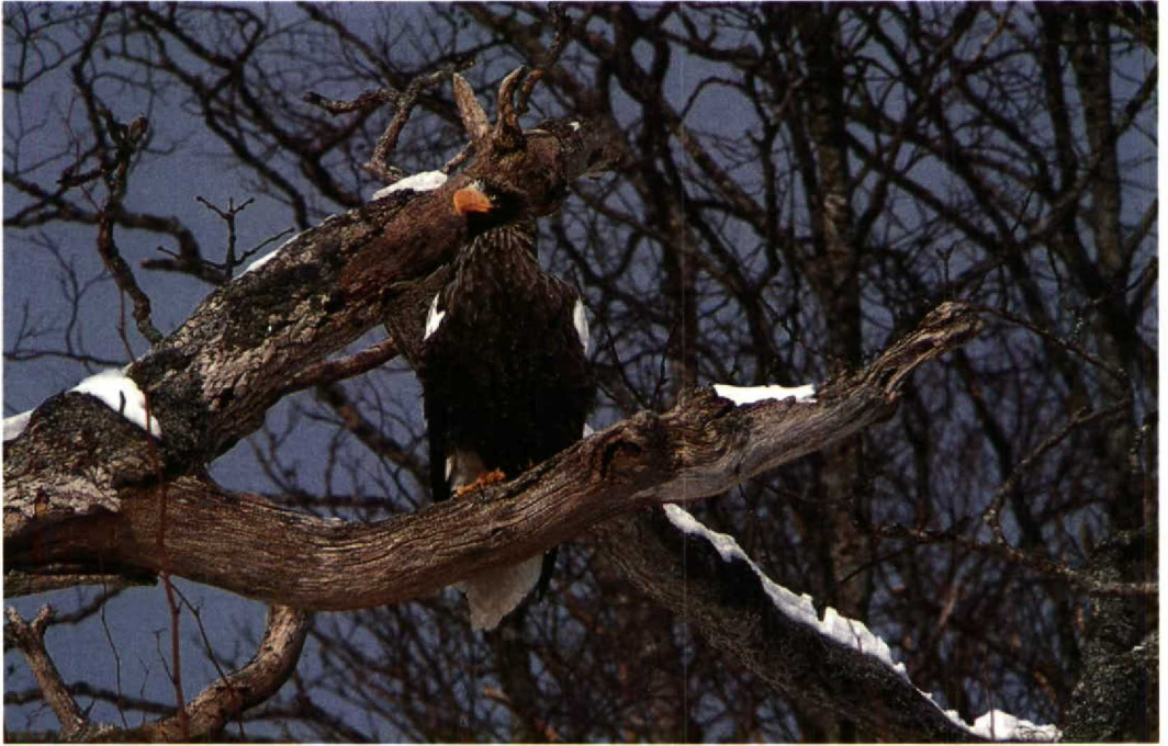
31 Steller's Sea Eagle / Stellers Zeearend Haliaeetus pelagicus , Hokkaido, Japan, February 1988