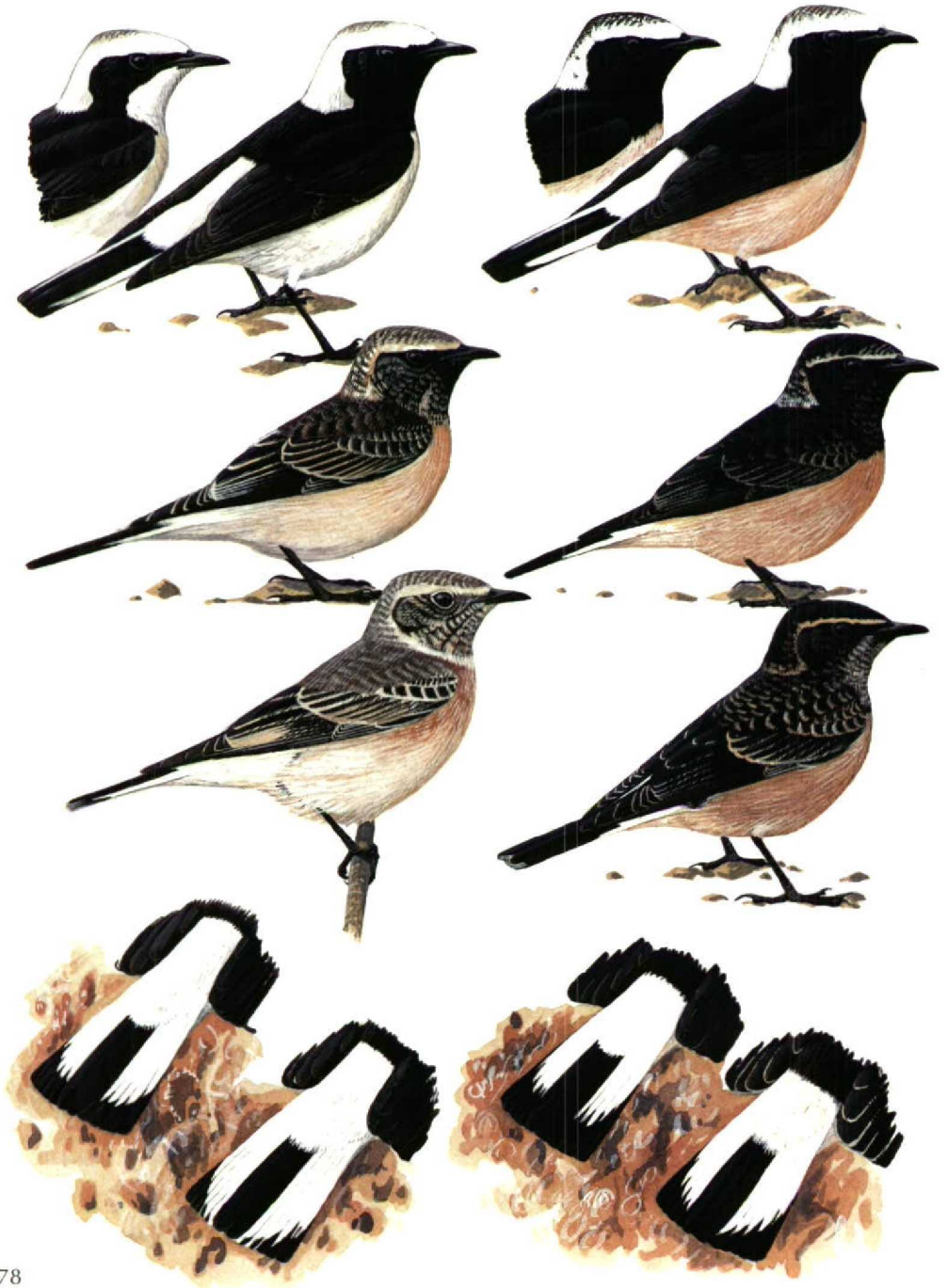
FIGURE 1 Plumages of Pied Wheatear / Bonte Tapuit Oenanthe pleschanka (left) and Cyprustapuit Oenanthe cyriaca (right) (Brian J Small). Upper: adult-summer males (inset head on left showing adult-summer male of pale-throated form of Pied O p 'vittata', inset head on right showing variability of dark crown of Cyprus Pied). Middle: adult-winter males. Lower: first-winter males. Below: tails and rumps showing differences in size of white rump and showing examples of variability of black and white in tail pattern