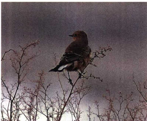
169 Bonte Tapuit / Pied Wheatear Oenanthe pleschanka , vermoedelijk eerste-winter vrouwtje, Katwijk, Zuidholland, 3 november 1992

De broedgebieden van de Bonte Tapuit liggen langs de kusten van de Zwarte Zee in Roemenië en Bulgarië oostelijk tot voorbij het Baikalmeer in Aziatisch Rusland, en zuidelijk tot Afghanistan. De overwinteringsgebieden liggen in Oosten-Noordoostafrika, van Egypte tot in Kenya (Cramp 1988). In Noord- en Noordwesteuropa wordt de Bonte Tapuit vrijwel jaarlijks als dwaalgast vastgesteld (Lewington et al 1991). De meeste gevallen komen uit Groot-Brittannië en Ierland, 28 tot en met 1992 (Rogers & Rarities Committee 1993). Het betreft voor het overgrote deel najaarsgevallen. De meeste zijn vrij laat in het najaar, vooral rond eind oktober.