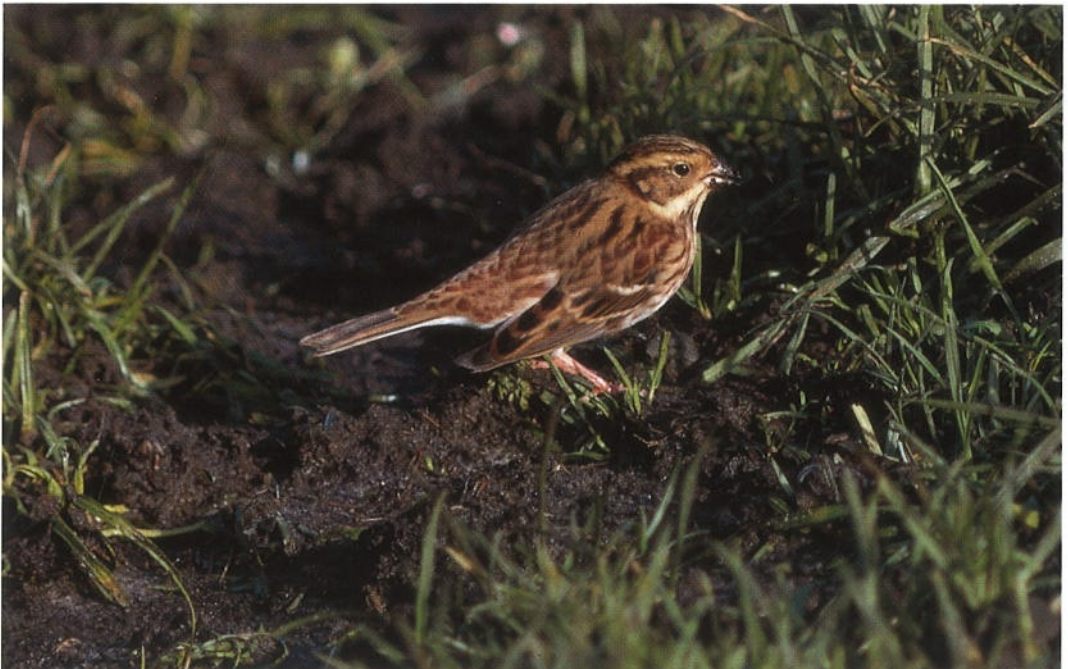
104 Rustic Bunting / Bosgors Emberiza rustica , Petten, Noordholland, 26 October 1992 (Arnoud B van den Berg)