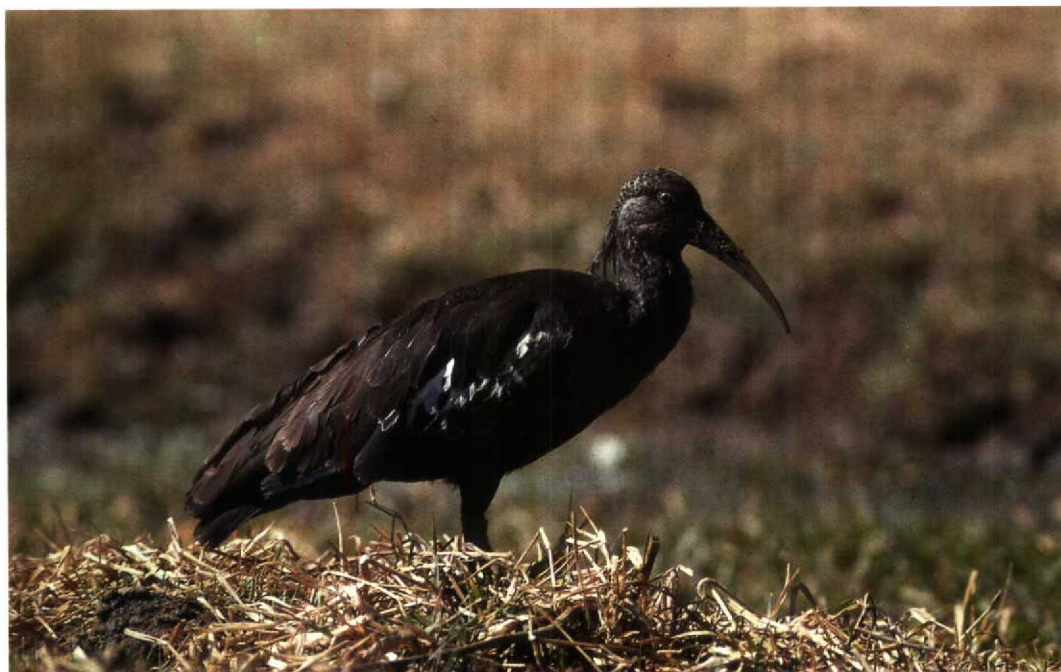
185 Wattled Ibis / Lelibis Bostrychia carunculata , Lake Langano, Ethiopia, December 1990 (Karel Beylevelt)