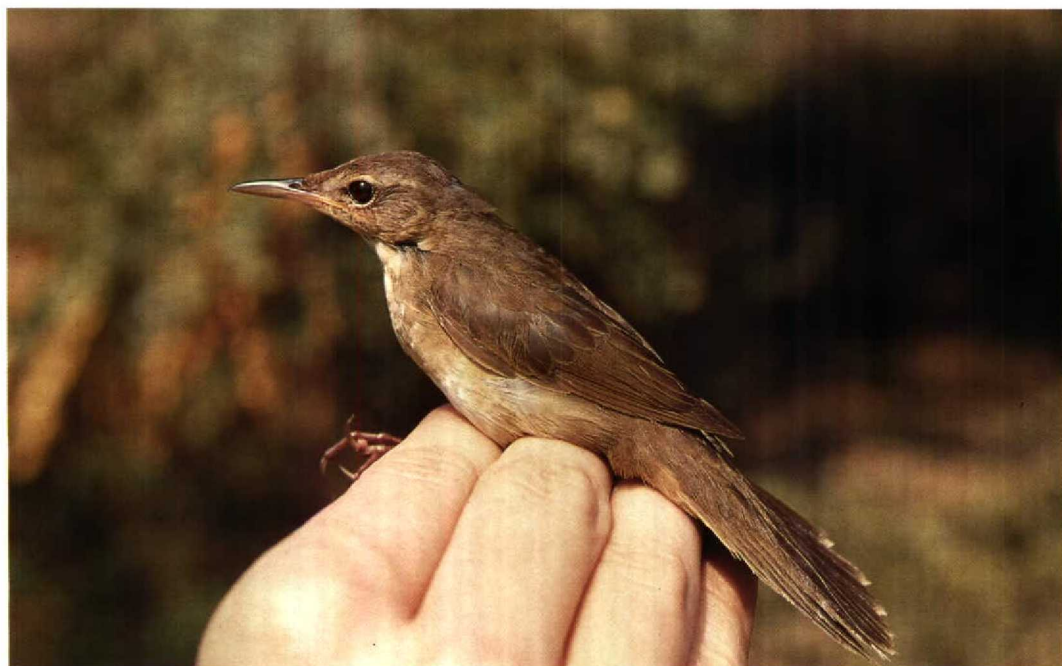
171 Styan's Grasshopper Warbler / Koreaanse Sprinkhaanzanger Locustella pleskei , Mai Po Marshes NR, Hong Kong, 9 September 1991

Middendorff's and Styan's occupy distinct breeding and wintering ranges and do not come into contact except occasionally in coastal China. During the breeding season, Middendorff's is confined to the maritime regions of eastern Russia which surround the Sea of Okhotsk including Sakhalin, Kamchatka, the Commander Islands and the Kuril Islands (Dement'ev & Gladkov 1968, Stepanyan 1990), as well as northern and eastern Hokkaido in northern Japan (Stepanyan 1990, Brazil 1991). In winter, it is found throughout the Philippines (Dickinson et al 1991) and has been recorded south to Sulawesi and Luang, Indonesia (White & Bruce 1986). As a migrant, Middendorff's was recorded by La Touche (1912, 1925-34) as passing in numbers at Shaweishan, an island 30 km off the mouth of the Yangtze