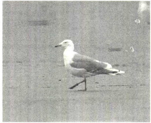
180 Herring Gull / Zilvermeeuw Larus argentatus argentatus , adult, with black marks on wing-tip probably restricted to two or three outermost primaries, IJmuiden, Noordholland, 10 February 1990

W (Ted) Hoogendoorn, Notengaard 32, 3941 LW Doorn, Netherlands Klaas J Eigenhuis, Seringenstraat 6, 1431 BJ Aalsmeer, Netherlands Jaap van 't Hof, Lijnbaan 3, 1431 CH Aalsmeer, Netherlands