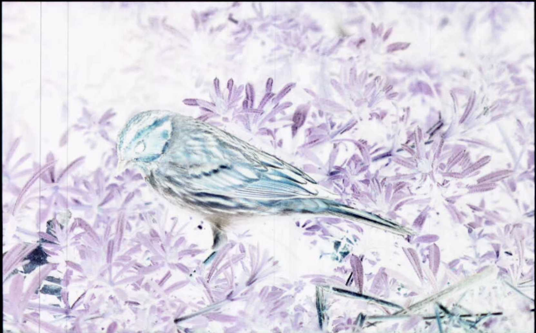
81 Little Bunting Emberiza pusilla , Katwijk aan Zee, Zuidholland, 5 April 1990 (Arnoud B van den Berg)