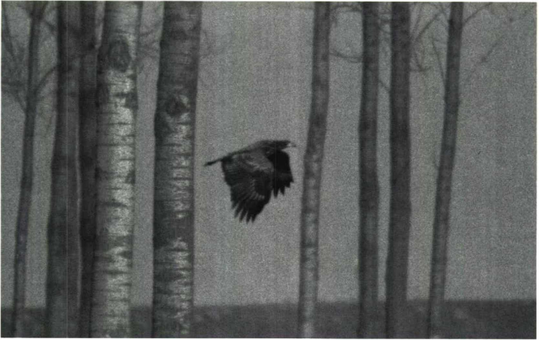
66 Zearend Haliaeetus albicilla , Verdrongen land van Saeftinge, Zeeland, februari 1992 (Hans Cebuis)