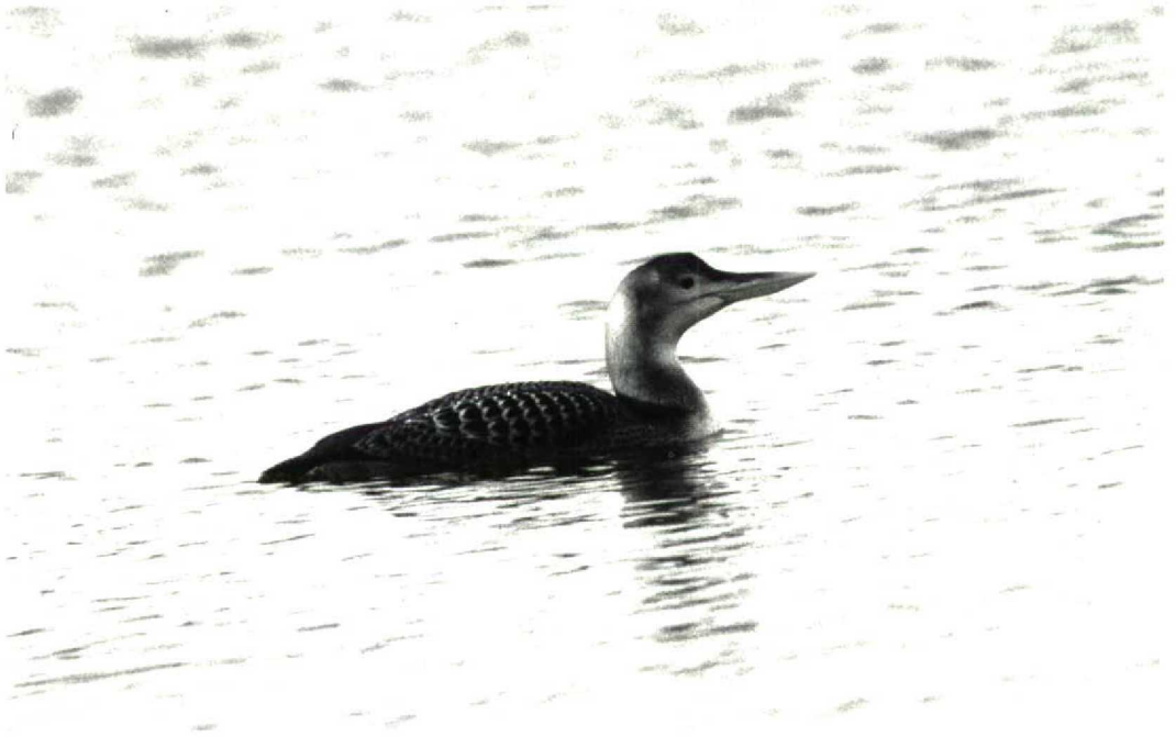
59 White-billed Diver Gavia adamsii , first-winter, Ahausen, Diepholz, Niedersachsen, Germany, January 1992 (Stefan Pfützke)

dam and Oude Tonge, Zuidholland, the Netherlands, from 22 January onwards, appeared to be accompanied by two 'hybrid' juveniles; out of c 60 previous records of Black Brant in the Netherlands, this might be the first of one having offspring. In Ireland, a Black Brant at Newcastle, Down, was wintering along with a hybrid Brent Goose until mid-February. In late January, 10 Dark-bellied Brent Geese at Merja Zerga constituted the first record of this species for Morocco. From 20 to at least 26 January, an (unringed) adult male Falcated Duck Anas falcata was present in a flock of Gadwalls A strepera at Bloemendaal, Noordholland. Until at least mid-April, presumably the same bird remained with a flock of Gadwalls south of Bennebroek, Noordholland. If accepted, this will be the second record of this species for the Netherlands. Thailand had a good winter for rare ducks with two species new for the country. On 11 January, two male and two female Baikal Teal A formosa were discovered among an assemblage of over 12 000 Garganey A querquedula at Kamphaengsaen, Nakhon Pathom, and at least one male was still present on 9 February. Another long-expected first record for Thailand was a male Mallard A platyrhynchos at Chiang Saen Lake, in the extreme north of the country, on 27 December 1991. The Ring-necked Duck Aythya collaris at Merja Khalloufa, Moroc-