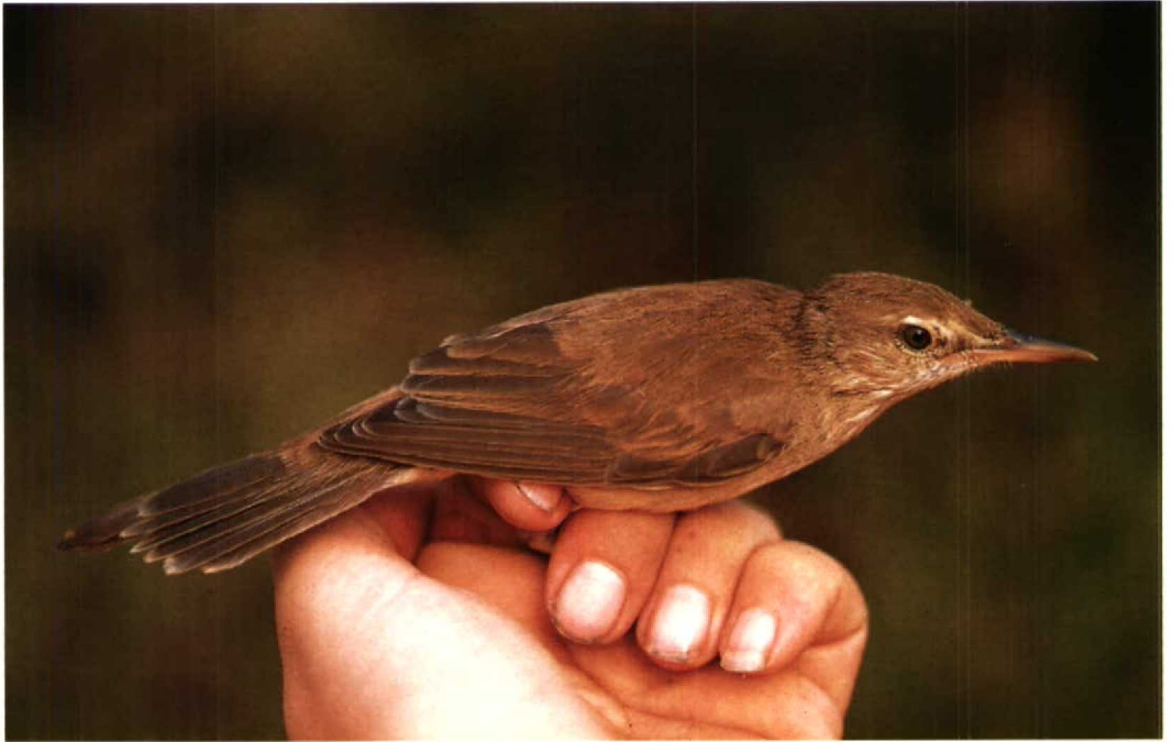
52 Clamorous Reed Warbler Acrocephalus stentoreus , showing damaged tail, southern Red Sea, Saudi Arabia, October 1991