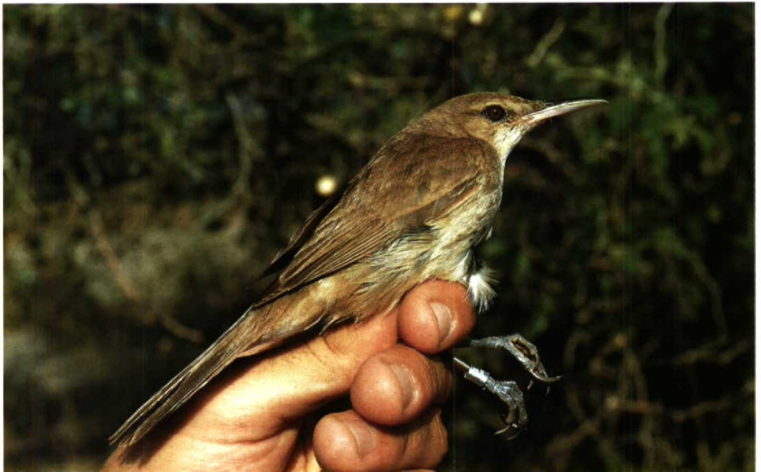
53 Western Clamorous Reed Warbler Acrocephalus stentoreus stentoreus , Israel, May 1986 (Hadoram Shirihai)