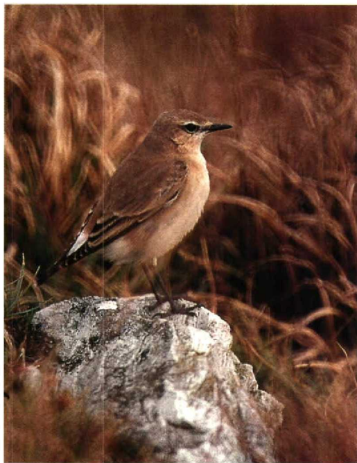
199 Isabelline Wheatear Oenanthe isabellina , Cork, Ireland, October 1992 (Paul Archer)

pomarina were seen, respectively. In Denmark, Spotted Eagles A clanga were present in Sjaelland on 29 September and 7 October. There were also two Steppe Eagles A nipalensis in Skåne and one was in Sjaelland (seen crossing the sea). In Finland, three were present during the summer. An adult Imperial Eagle A heliaca at Falsterbo, Skåne, on 17-18 September formed the 10th record for Sweden. A first-year Peregrine Falco peregrinus with a Finnish ring (D148773, ringed on 7 July 1992 in western Lappland, Finland) was trapped and released at Dronrijp, Friesland, the Netherlands, on 19 September. Hazel Grouse Bonasa bonasia still survive in the French Pyrénées, with recent sightings reported from Couledoux, Haute-Garonne. On 10 October, an adult Demoiselle Crane Anthropoides virgo was present in a flock of Cranes Grus grus in Mecklenburg, Germany. On 2-11 October, an immature Black-winged Pratincole Glareola nordmanni stayed around Davidstow airfield, Cornwall. On 19 August, two first-year Semipalmated Plovers Charadrius semipalmatus were seen at Paúl da Praia, Ilha Terceira, Azores (cf Dutch Birding 13: 139-140, 1991; 14: 173-176, 1992). On 20 August, a Kittlitz's Sand Plover C pecuarius was trapped and photographed in Bahrain. Sociable Plovers Chettusia gregaria at Tiel, Gelderland, on 25-27 September and at Nijkerk, Gelderland, on 22 November were already the fourth and fifth in 1992 for the Netherlands. At Tarut, North-Eastern Province,