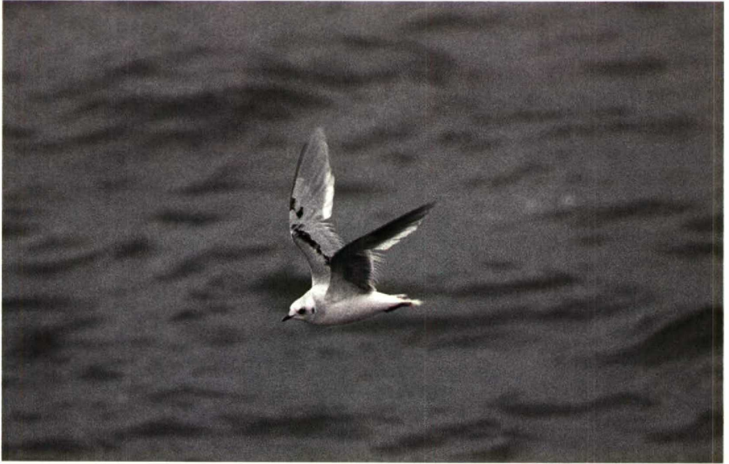
211 Ross' Meeuw Rhodostethia rosea , tweede-winter, IJmuiden, Noordholland, 22 november 1992 (Roy de Haas)