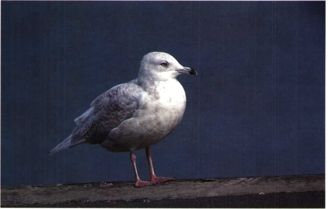
159 Kumlien's Gull Larus kumlieni kumlieni , second-winter, Le Portel, Pas-de-Calais, France, 12 September 1992 (Arnoud B van den Berg) 160 Ring-billed Gull Larus delawarensis , moulting to second-winter, Le Portel, Pas-de-Calais, France, 25 July 1992 (Arnoud B van den Berg)