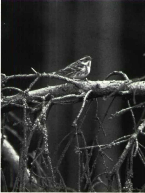
106 Bosgors Emberiza rustica , Logbiermé, Luik, België, 21 maart 1992

een mannetje Rosse Stekelstaart Oxyura jamaicensis terwijl een (mak) adult vrouwtje van 2 maart tot 20 april bij Duffel A verbleef. Het onvolwassen vrouwtje Witkopeend O leucocephala bleef nog tot ten minste 31 maart present op de plas bij de Blauwe Toren te Brugge Wvl. Vanaf 1 april begon de doortrek van Zwarte Wouwen Milvus migrans . Er was een totaal van 19 exemplaren met waarnemingen te Angre H, Burcht A, Doel Ovl, Duffel, Etalle Lux, Frasnes-les-Buissenal, Genappe B, Heist o/d Berg A, Hoeke Wvl, Kallo Ovl, Knokke Wvl, Latour Lux, Lier, Longchamps N, Maaseik L, Tessenderlo en Virton. Vanaf 26 april pleisterde er één bij Harchies-Hensies. De 22 gemelde Rode Wouwen M milvus kwamen van Baarle-Drongen Ovl, Blokkersdijk (zes), Booischot A, Bredene, De Haan Wvl, Geel A (twee), Heist o/d Berg, Kalmthout A, Kontich A (twee), Lier (twee), Muizen, Oud-Turnhout A, Sint-Pieters-Kapelle Wvl en Wuustwezel A. Vanaf 29 maart werden gespreid over de periode 12 Visarenden Pandion haliaetus gemeld, met waarnemingen te Duffel, Harchies (vier), Lier, Linkhout L, Mechelen A, Musson Lux, Neerijse B (drie), Testelt L en Zeebrugge. Over de hele periode waren 12 waarnemingen van Slechtvalken Falco peregrinus gespreid over Angre, Doel, Evergem-Kluizen Ovl, Leefdaal B, Lier, Mouscron H, Oostende (twee), Quévy H, Turnhout A, Wenduine Wvl en Wuustwezel.