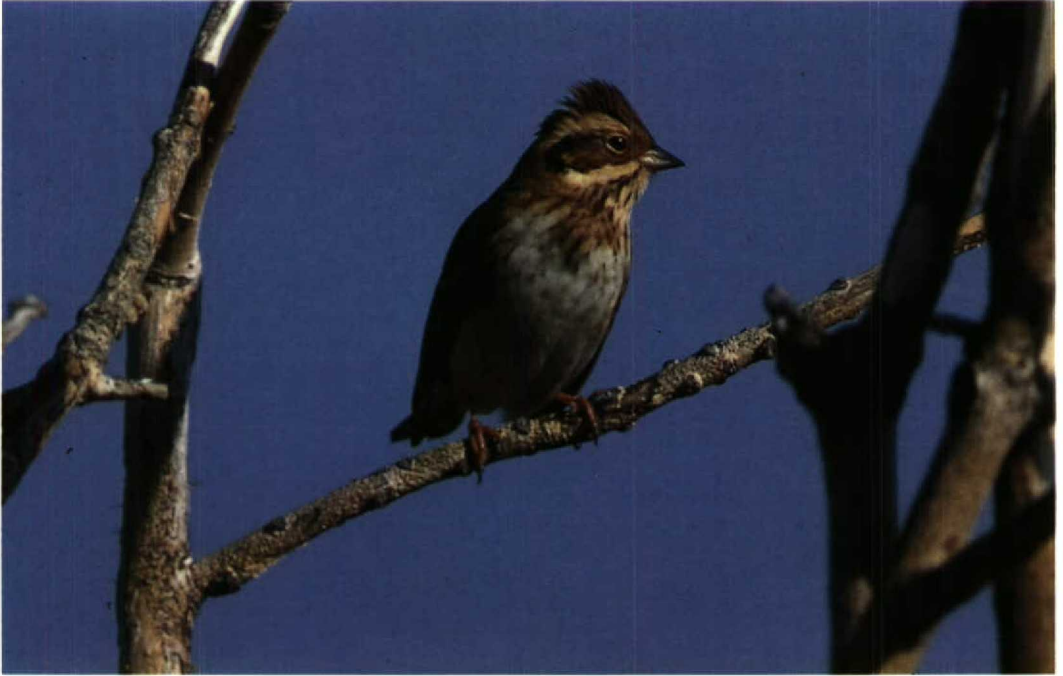
82 Rustic Bunting Emberiza rustica , Westkapelle, Zeeland, September 1990 (Hans Gebuis)