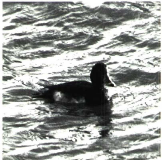
168 Ring-necked Duck x Tufted Duck hybrid A collaris x fuligula , first-year male, Goedereede, Zuidholland, 6 January 1991 (Staf Elsermans)

Whilst studying the bird, a number of possibilities were considered. It was probably not a first-summer male Ring-necked Duck because of the rounded head and the short forward extension of the flanks, caused by the broad black breast (Gillham 1986). First-summer male Tufted Duck can be excluded by the sharp white subterminal band on the bill. The bill pattern of Paget's Pochard- or Ferruginous Duck-type hybrid A ferina x nyroca (Gillham et al 1966) could possibly fit but neither the black upperparts nor the white brown-dashed flanks match this hybrid type. According to Gillham et al (1966), Baer's Pochard-type hybrid A fuligula x nyroca very much resembles a male Ring-necked Duck. The bill tip, however, shows less black and the flanks are clouded brown all-over. The bird also differed notably from the presumed hybrid between Ring-necked and Tufted Ducks A collaris x fuligula that was observed by Vinicombe (1982)