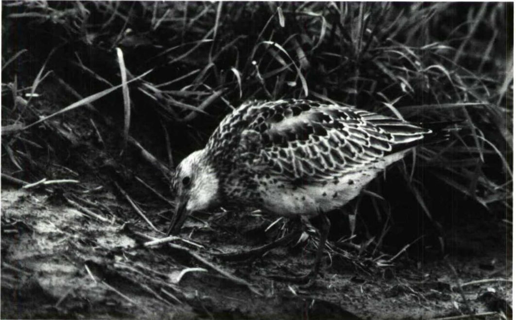
182 Grote Kanoet Calidris tenuirostris , Camperduin, Noordholland, 1 oktober 1991

Het lijkt zeker dat het hier dezelfde vogel betreft die van 17 tot 27 september 1991 op de Shetlands, Britannië, verbleef. Deze was op vrijdag 27 september om c 12:00 in zuidoostelijke richting weggevlogen en heeft waarschijnlijk ruim 24 uur doorgevlogen, tot grote blijdschap van vogelend Nederland. MAX BERLIJN