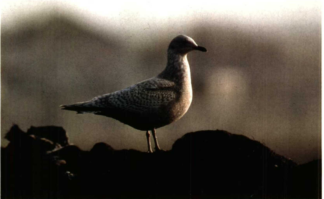
113 Thayer's Gull Larus glaucooides/kumlieni cf. thayeri , Galway, Galway, Ireland, January 1991 ( Jack Malins )