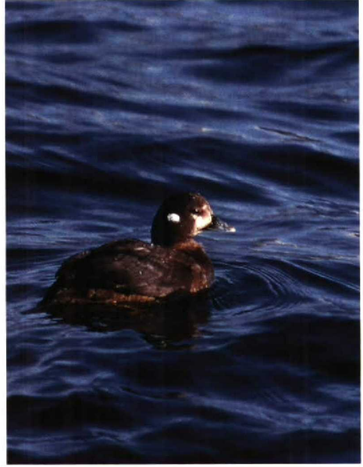
108 Harlequin Duck Histrionicus histrionicus , Wick, Highland, Britain, February 1991