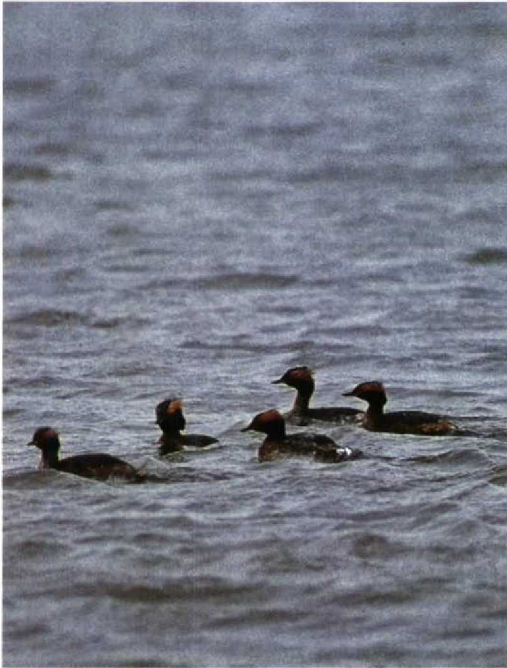
115 Kuifduikers Podiceps auritus , IJmuiden, Noordholland, april 1991 (Piet Munsterman)

Aythya nyroca was op 29 maart en 14 april aanwezig in de buurt van Haaksbergen O. De Koningseider Somateria spectabilis van Hoek van Holland Zh hield daar weer audiëntie van 28 tot 31 maart en op 14 en 15 april. Een mannetje Brilzeeëend Melanitta perspicillata werd geclaimd op 2 mijl ten noorden van Terschelling Fr op 22 april. In deze maanden werden 32 Zwarte Wouwen Milvus migrans en 56 Rode Wouwen M. milvus gemeld. De Zwarte Wouwen werden voornamelijk in april waargenomen. Een Zeearend Haliaeetus albicilla werd op 20 maart gemeld te Veenhoop Fr. Een exemplaar zat op 29 maart en 1 april op de Dintelse Gorzen Nb. Vanaf 12 april trokken de eerste Grauwe Kiekendieven Circus pygargus alweer het land in. Vier exemplaren werden gezien. Een Steenarend Aquila chrysaetos werd geclaimd in Velp Gld op 11 maart. Al op 14 maart vloog een Visarend Pandion haliaetus over Rotterdam. Vanaf 24 maart werden c 30 exemplaren gezien waarvan sommigen enkele dagen op een plek verbleven. Roodpootvalken Falco vespertinus vlogen voorbij de Knardijk Fl op 11 april, over Groningen Gr op 14 april, langs Breskens op 25 april (twee) en over Lexkesveer bij Wageningen Gld op 27 april. Tot begin april waren op diverse lokaties nog c 20 Slechtvalken F. peregrinus aanwezig. Een doortrekker vloog op 28 april over de Ooijpolder Gld.