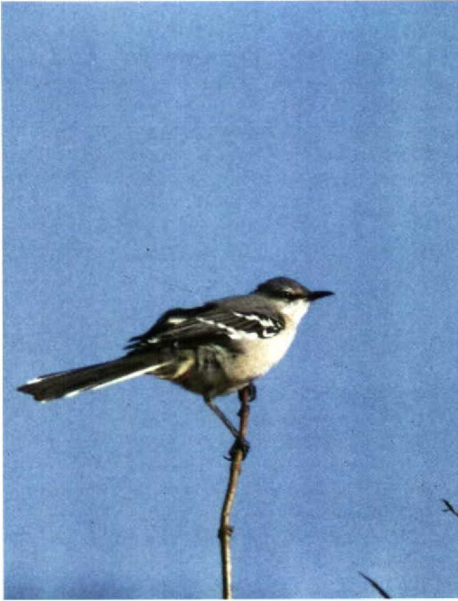
89 Spotlijster Mimus polyglottos , Schiermonnikoog, Friesland, oktober 1988 (Sander van de Water)