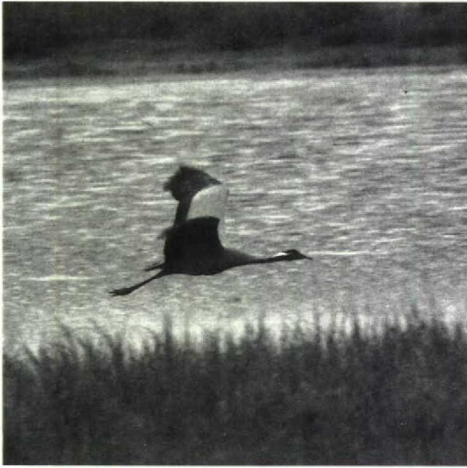
94 Demoiselle Crane Anthropoides virgo , Kurgaldzjino, USSR, May 1989. Sometimes white pattern of head differs markedly from that of Crane. Note how narrow and difficult to see black breast-band may be when seen from the side. Note also broad base to wing, short tail and pale upper surface to wing

opposite the centre of the wingbase (figure 4, plates 91 and 94). Quite often, however, it is very difficult to assess this pattern properly (cf plate 93). Sometimes, the legs and the neck are relatively shorter in the smaller Demoiselle Crane. The wings of Demoiselle Crane are slightly shorter and, perhaps more importantly, slightly broader at the base than in Crane. The tail is shorter and the head may look larger.