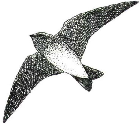
FIGURE 1 Brown-throated Sand Martin Riparia paludicola , Suez, Egypt, April 1990 (after field sketch, Hans Schekkerman)

The Egyptian Wetland Project 1990 was organised by the International Waterfowl and Wetlands Research Bureau, the Foundation for Ornithological Research in Egypt and the Egyptian