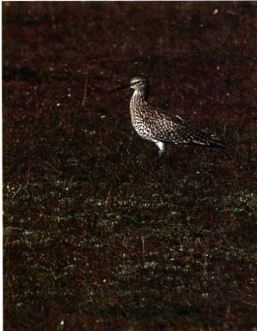
109-110 Slender-billed Curlew Numenius tenuirostris , Merja Zerga, Morocco, January 1991 (Hans Gebuis)