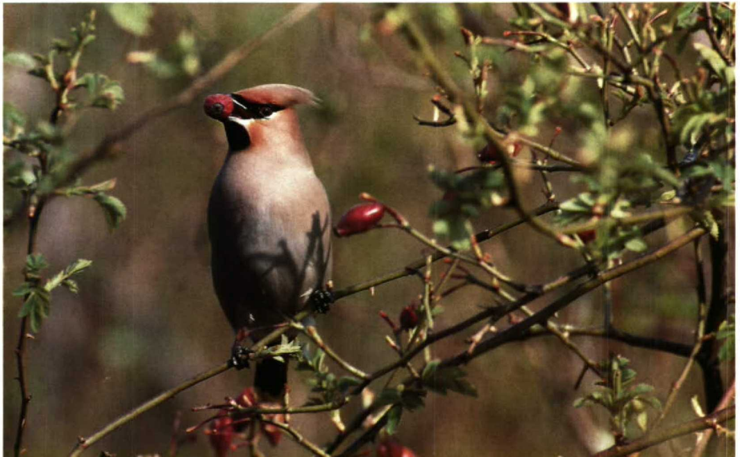
120 Pestvogel Bombycilla garrulus , Almere, Flevoland, april 1991