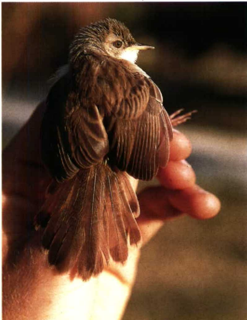
98-99 Graceful Warbler Prinia gracilis , juvenile showing fresh plumage and dull iris colour, Suez, Egypt, April 1990

On 20 May, in a salt marsh c 10 km south of Port Said, I observed at close range two Graceful Warblers delivering food at a nest hidden in the lower part of dense vegetation. Both birds were adults and they formed a pair, giving alarm calls as I approached. Only one of the birds sang during my 15 min presence and this individual had a completely black bill and interior mouth. The bill of the other bird was dark horn with a pale proximal half of the lower mandible. Besides the difference in bill colour, the singing bird (assumed to be a male) had an unmarked greyish-white breast and belly and rather bright straw-yellow (or slightly orangy) legs