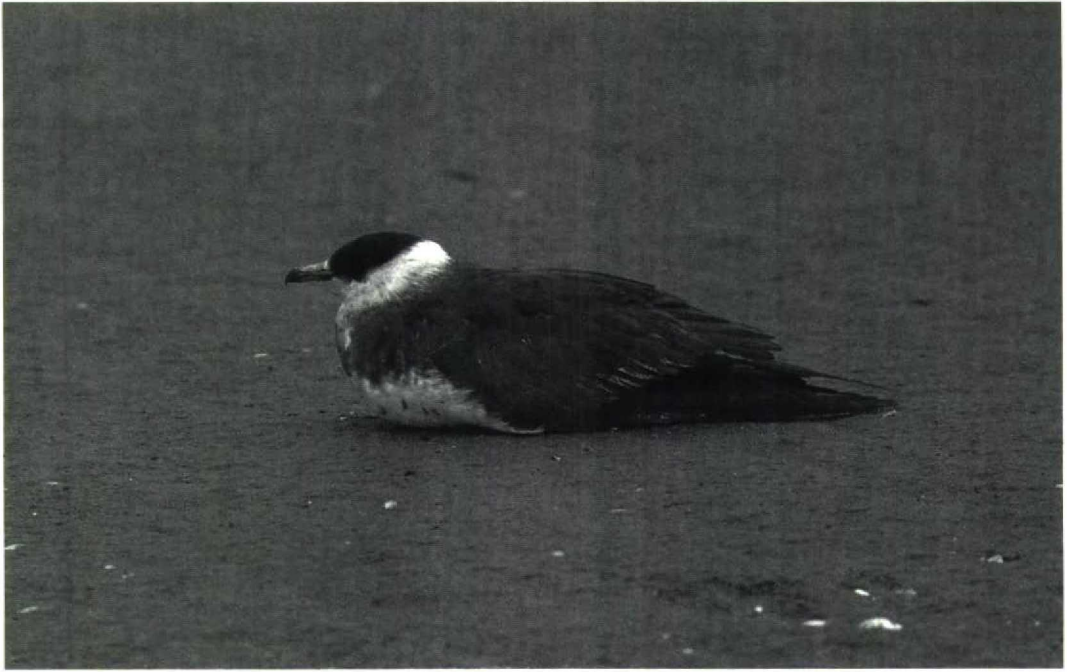
105 Arctic Skua Stercorarius parasiticus , Maasvlakte, Zuidholland, August 1981