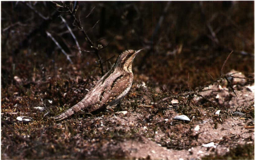
119 Draaihals Jynx torquilla , Maasvlakte, Zuidholland, april 1991