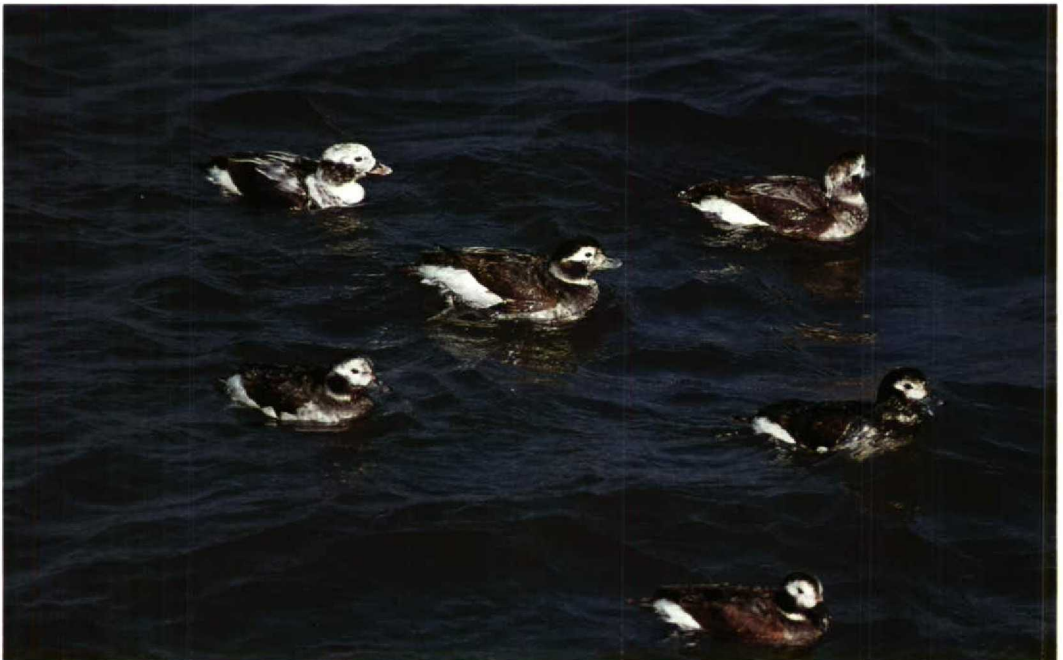
116 IJseenden Clangula hyemalis , IJmuiden, Noordholland, april 1991 (Piet Munsterman)

KRAANVOGELS TOT ZEEKOETEN Massale doortrek van Kraanvogels Grus grus vond plaats tussen 2 en 17 maart