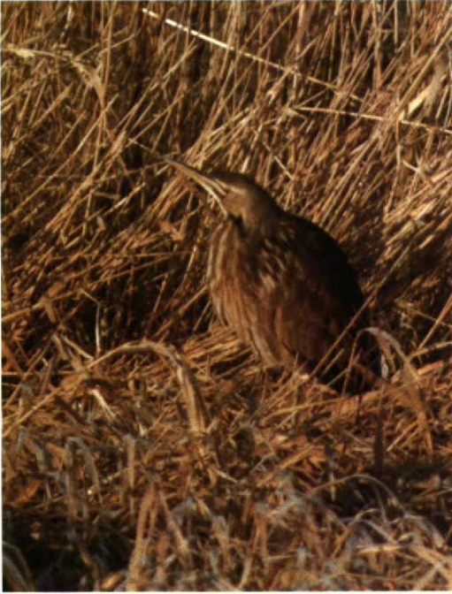
107 American Bittern Botaurus lentiginosus , Marton Mere, Blackpool, Lancashire, Britain, February 1991