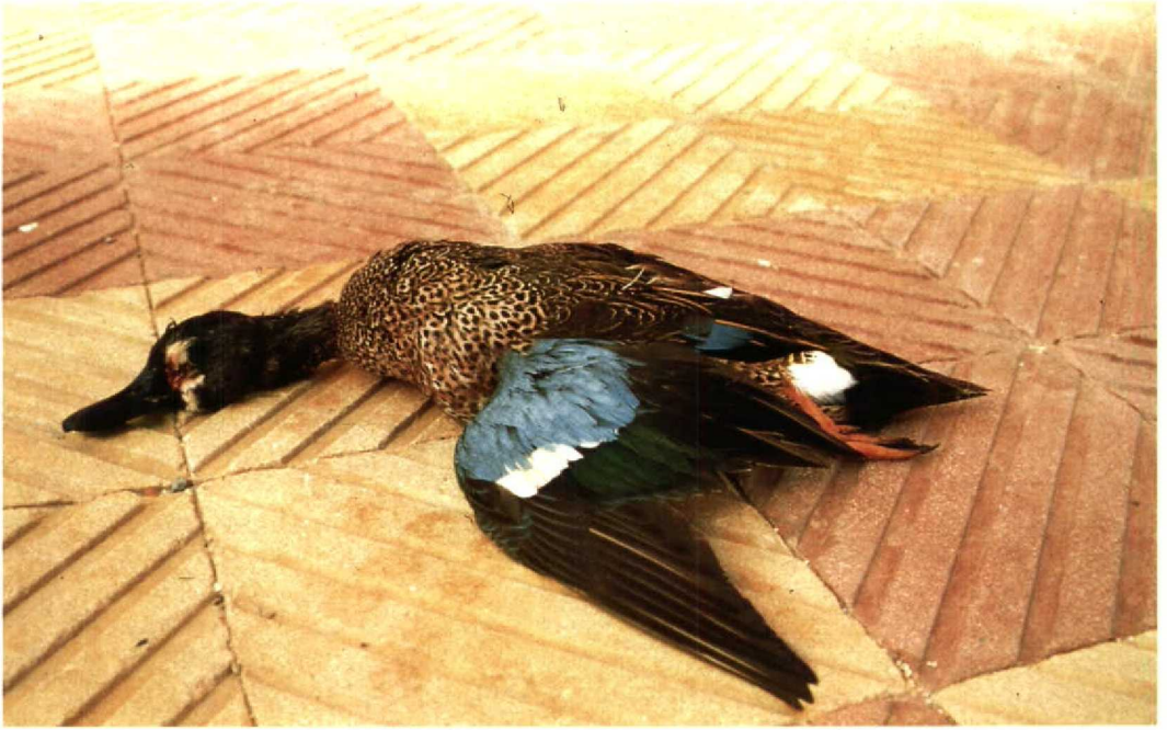
95 Blue-winged Teal Anas discors , shot at Lake Burullus, Egypt, March 1990 (Frank E de Roder)

from Algeria (Dejonghe 1981) and seven from Morocco (Michel Thévenot in litt), including the recovery in October 1970 of a bird ringed at Prince Edward Island, Canada (Dejonghe 1981). It is possible that the Blue-winged Teal found in Egypt joined a flock of Garganey somewhere in western Africa during the winter and subsequently reached Egypt during spring migration.