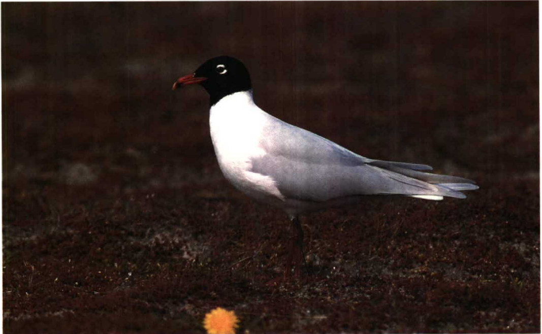
118 Zwartkopmeeuw Larus melanocephalus , Maasvlakte, Zuidholland, april 1991 (René van Rossum)