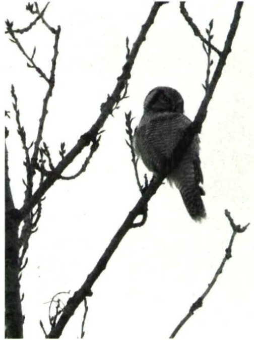
112 Hawk Owl Surnia ulula , Farum, København, Sjælland, Denmark, February 1991 (Arnold Meijer)