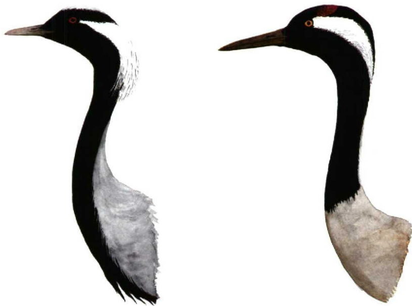
FIGURE 1 Demoiselle Crane Anthropoides virgo (left) and Crane Grus grus . Demoiselle is distinguished by white tuft on hindneck, blackish breast-feathers, pale crown and short bill. Crane has pale breast, red patch on crown and long bill (Magnus Ullman)

In flight, the head pattern may be impossible to discern. The best distinguishing feature is the black breast in Demoiselle Crane, reaching roughly to