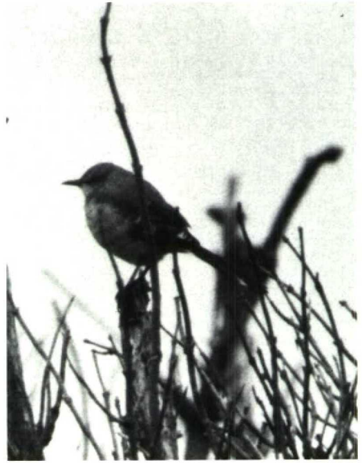
90 Spotlijster Mimus polyglottos , Schiermonnikoog, Friesland, oktober 1988

Brittannië enkele soorten vastgesteld die door Robbins (1980), in zijn lijst van potentiële Nearctische dwaalgasten naar Europa, als minder waarschijnlijke dwaalgasten werden gerangschikt of zelfs niet in de lijst werden genoemd, zoals Geelvleugelzanger Vermivora chrysoptera en Rosse Boomklever Sitta canadensis (Doherty 1989, Hutton & Varney 1989, Rogers & Rarities Committee 1990).