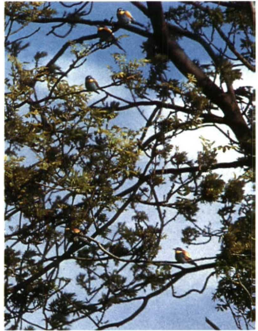
121 Bijeneters Merops apiaster , Kreileroord, Noordholland, mei 1991 (Laurens van der Vaart)

Bijeneters zijn in Nederland meerdere malen tot broeden gekomen. De laatste keer was op Texel Nh in 1983