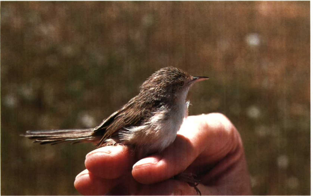
100 Graceful Warbler Prinia gracilis , adult, presumably female, showing bright iris colour and pale bill, Suez, Egypt, April 1990 (Hans Schekkerman) 101 Graceful Warbler Prinia gracilis , adult male showing black bill, Hula, Israel, March 1990 (René Pop)