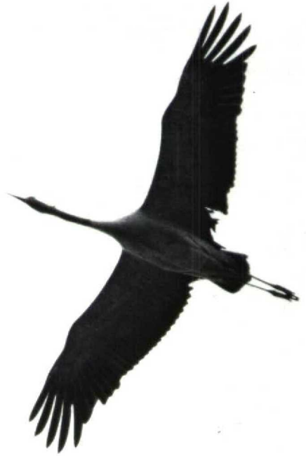
91 Demoiselle Crane Anthropoides virgo , Tselinograd, USSR, May 1989. Note proportions of wing, short tail and how far down black breast reaches ( Magnus Ullman ) 92 Crane Grus grus , sine loco, sine dato. Wing usually has more even width than in Demoiselle Crane (but variations occur). Regularly, wing narrows near body ( Jens B Bruun ) 93 Cranes Grus grus , Västervik, Sweden, May 1973. Note difficulty in assessing how far black of neck extends ( Axel von Arbin )