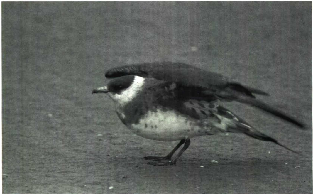
106 Arctic Skua Stercorarius parasiticus , Maasvlakte, Zuidholland, August 1981 (René Pop)