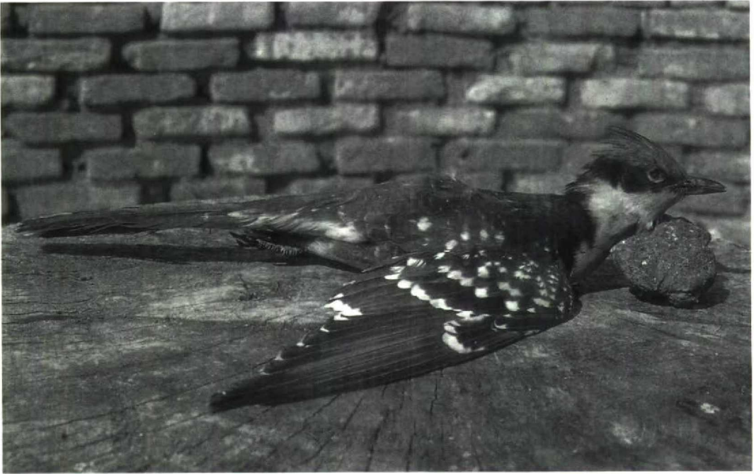
117 Kuifkoekoek Clamator glandarius , Lelystad, Flevoland, april 1991