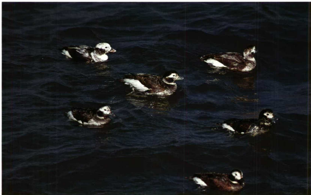
116 IJseenden Clangula hyemalis , IJmuiden, Noordholland, april 1991 (Piet Munsterman)

KRAANVOGELS TOT ZEEKOETEN Massale doortrek van Kraanvogels Grus grus vond plaats tussen 2 en 17 maart