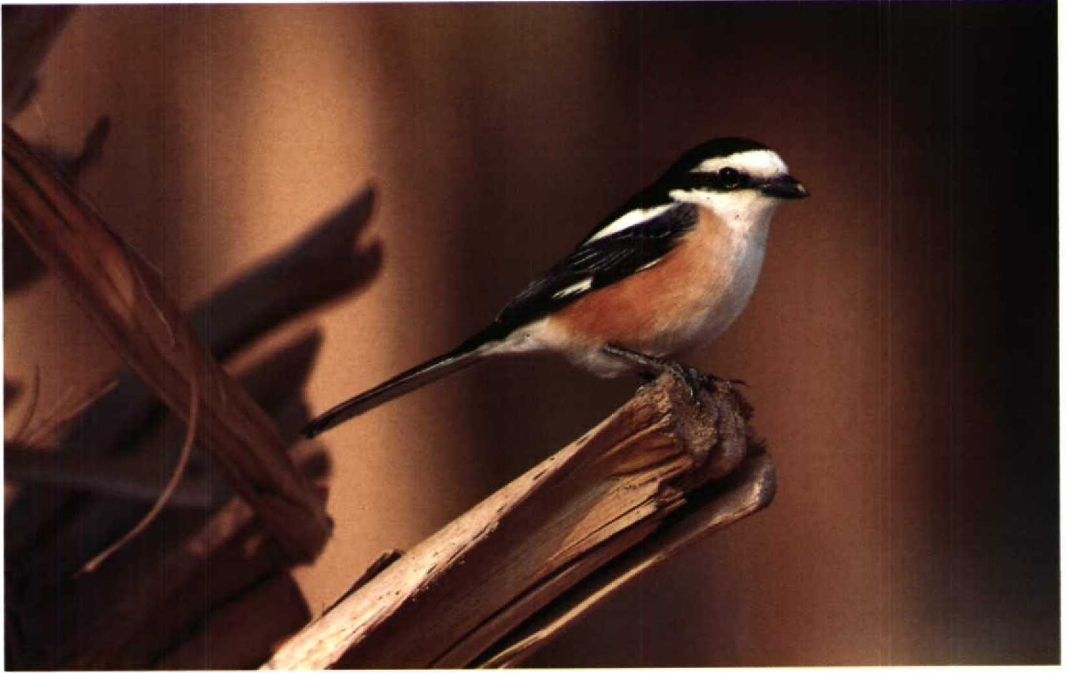
30 Masked Shrike Lanius nubicus , Eilat, Israel, March 1990 (René Pop) 31 Desert Finch Rhodospiza obsoleta , Eilat, Israel, March 1990 (René Pop)