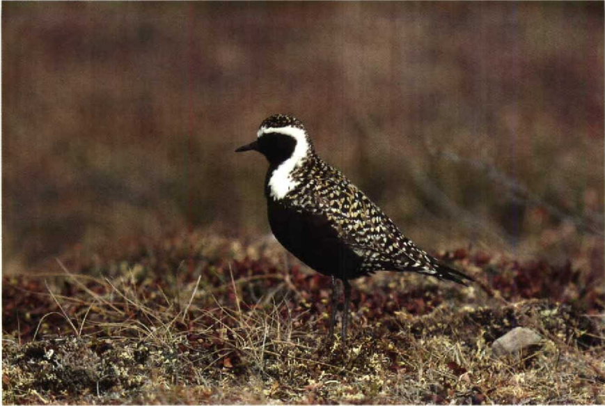
163 P dominica , Alaska, USA, June 1985 (Rinie van Meurs) 164 P fulva , Oahu, Hawaii, April 1989 (René Pop)