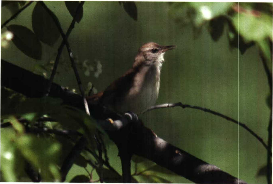
138 Gray's Grasshopper Warbler Locustella fasciolata , Irkutsk, USSR, June 1985 (Huub Huneker)

nobaenus . Finally plate 138 shows a much larger species, Gray's Grasshopper Warbler L. fasciolata , which is superficially similar to Great Reed Warbler A. arundinaceus , especially on a black-and-white photograph. However Gray's has sides of head and chest grey rather than yellowish-buff, flanks drab instead of yellowish-buff, belly whiter, and undertail-coverts warmer buff, less yellowish; the latter are also long, almost or completely reaching tip of outer tail-feather.