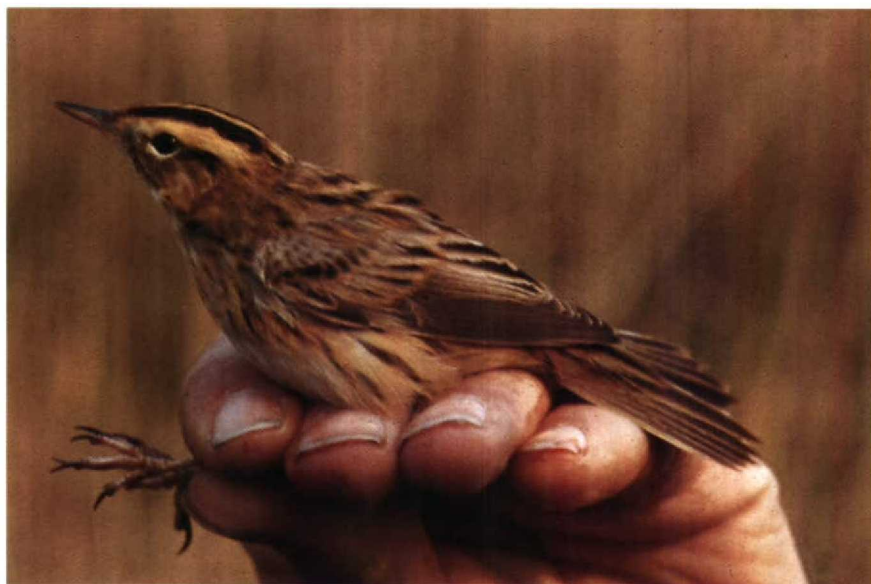
118-119 Aquatic Warbler Acrocephalus paludicola , Ruigoord, Noordholland, April 1978 (Arnoud B van den Berg)