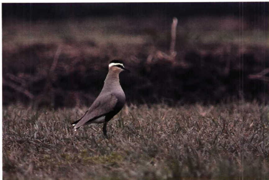
151 Steppiekievit Chettusia gregaria , IJsselstein, Utrecht, april 1990 (Paul Knolle) 152-153 Grote Grijsze Snip Limnodromus scolopaceus , Lauwersmeer, Groningen, mei 1990 (Jaap van 't Hof)