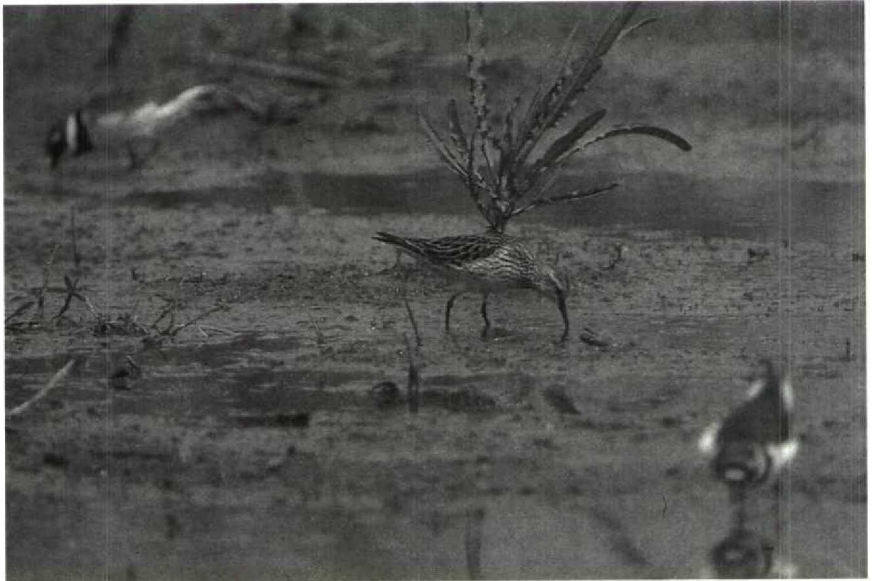
143 White-rumped Sandpiper Calidris fuscicollis , Nörten-Hardenberg, Niedersachsen, FRG, May 1990 (Frank Stühmer) 144 Greenish Warblers Phylloscopus trochiloides , Helgoland, Schleswig-Holstein, FRG, July 1990 (David G McAdams)