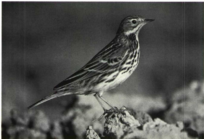
57-58 Red-throated Pipit Anthus cervinus , adult, Israel, November 1985