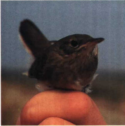
48 Savi's Warbler Locustella luscinioides with streaked breast, Greece, August 1987 (Caroline van de Woestijne)