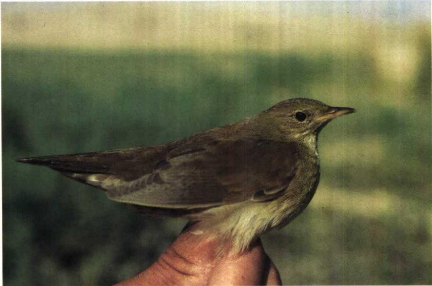
50 River Warbler Locustella fluviatilis , Elat, Israel, October 1985