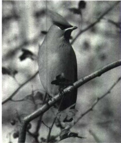
35 Pestvogel Bombycilla garrulus , juveniel, Schagen, Noordholland, november 1988 (Do van Dijck) 36 Pestvogel Bombycilla garrulus , Schagen, Noordholland, november 1988 (Do van Dijck)

plaren op 9 oktober, 12 en 22 november en 4 en 11 december. Op de Putten van Camperduin was er één van 9 tot 28 oktober en tussen 13 en 21 oktober zelfs twee. Overigens waren er meldingen op 10 oktober bij