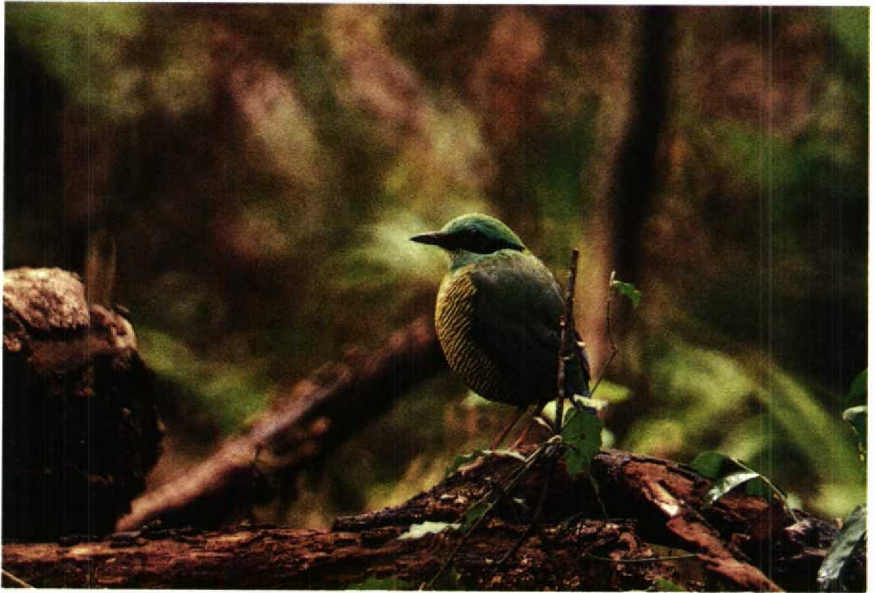
4 Elliot's Pitta Pitta ellioti , male, Kon Ha Nung forestry concession, Gia Lai-Kon Tum, Viet Nam, May 1988 (Frank G Rozendaal) 5 Elliot's Pitta Pitta ellioti , pair at nest, Kon Ha Nung forestry concession, Gia Lai-Kon Tum, Viet Nam, May 1988 (Frank G Rozendaal)