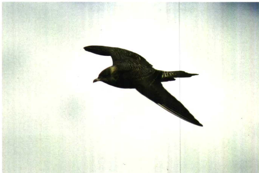
27 Kleinste Jager Stercorarius longicaudus , Westkapelle, Zeeland, oktober 1988 28 Kleinste Jager Stercorarius longicaudus , Goedereede, Zuidholland, oktober 1988